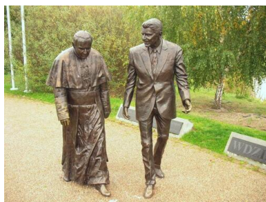
Pomnik papieża Jana Pawła II i prezydenta USA w l. 1981-1989 Ronalda Reagana w Gdańsku

Rock'n'roll okazał się środkiem przekazu, który nie tylko dostarcza rozrywki, ale mówi o ludzkim losie w szerszym znaczeniu, dotykając m.in. polityki i historii.