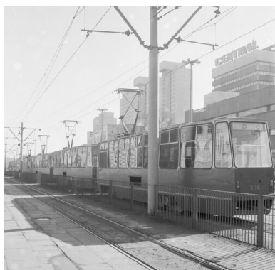
Centrum Łodzi - początek lat osiemdziesiątych XX w.

1 września po północy na ulice wyjechały pierwsze autobusy i tramwaje, a życie w mieście zdawało się powracać do normalnego rytmu. Przypomnijmy jednak, że strajki nie wygasły wraz z podpisaniem porozumień sierpniowych. Do licznych protestów dochodziło również w wrześniu. Ogółem pierwszych dni sierpnia do 3 października 1980 r. w województwie miejskim łódzkim strajkowało 65,5 tys. osób w 67 zakładach pracy. To dzięki nim w Łodzi i regionie mogła narodzić się „Solidarność”.