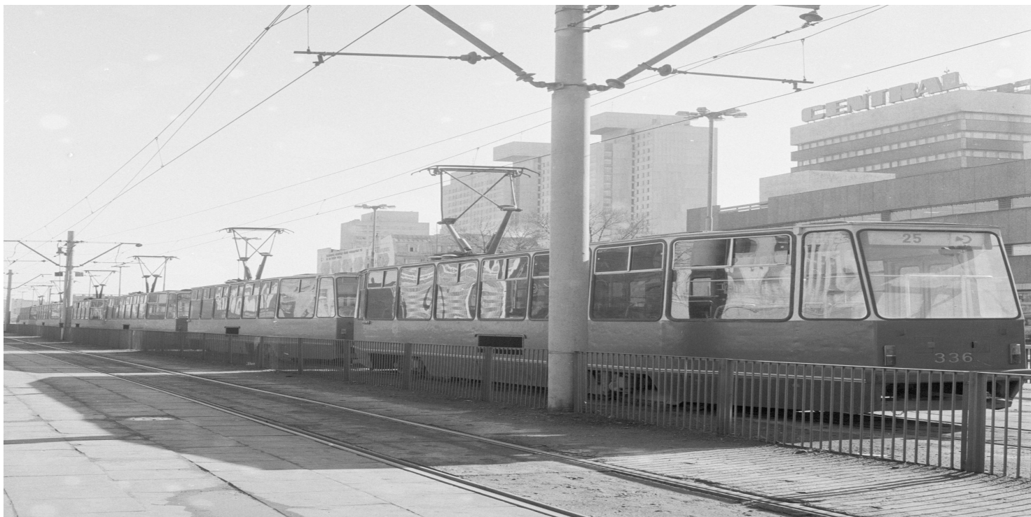
Centrum Łodzi - początek lat osiemdziesiątych XX w. (fot. Marek Widerkiewicz)

https://przystanekhistoria.pl/pa2/tematy/solidarnosc/85657,Strajk-w-lodzkiem-MPK.html