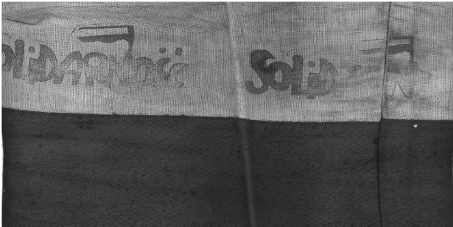
Opaski noszone przez członków Straży Robotniczej w czasie strajku okupacyjnego

https://przystanekhistoria.pl/pa2/tematy/solidarnosc/85768,NSZZ-Solidarnosc-z-perspektywy-malego-zakladu-pracy.html