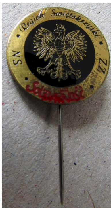
Pamiętkowa przypinka NSZZ „Solidarność” Regionu Świętokrzyskiego