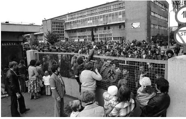
Rodziny strajkujących górników przy ogrodzeniu kopalni „Manifest Lipcowy”, Jastrzębie Zdrój, wrzesień 1980 r.

Komuniści próbowali poddać pismo rozmaitej kontroli, w tym oficjalnej cenzurze. Już w listopadzie 1980 r. analizą treści biuletynu zajął się specjalny zespół złożony z przedstawicieli Komitetu Wojewódzkiego partii, Komendy Wojewódzkiej MO, katowickiej Delegatury Głównego Urzędu Kontroli Prasy Publikacji i Widowisk oraz prokuratury. Wyniki prac zespołu zaprezentowano w grudniu 1980 r. na posiedzeniu sekretariatu KW PZPR w Katowicach. Według tych ustaleń biuletyn cechował