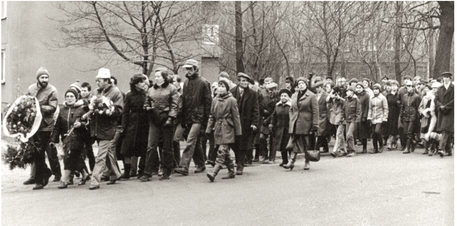
Anna Walentynowicz na czele pochodu idącego pod kopalnię „Wujek”; Katowice, 16 grudnia 1984 r. (fot. IPN)

https://przystanekhistoria.pl/pa2/tematy/solidarnosc/89405,Nielegalne-rocznice.html