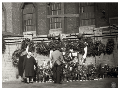
Zdjęcie z obserwacji przez SB ludzi gromadzących się pod krzyżem przy kopalni „Wujek”.

Ten krzyż, który towarzyszył górnikom z „Wujka” przez kilkanaście miesięcy tzw. karnawału „Solidarności”, został skradziony przez „nieznanych sprawców” 27 stycznia 1982 r. Górnicy, gdy tylko dowiedzieli się o kradzieży, zagrozili strajkiem, jeśli krzyż nie wróci na swoje miejsce. Sami wykonali nowy, bardziej masywny od poprzedniego. Powstał z dębowych prowadnic szybowych, wzdłuż których porusza się górnicza winda, czyli „szola”.