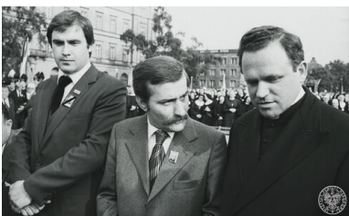
Jan Kułaj, Lech Wałęsa i ks. Henryk Jankowski uczestniczący

Wszelkie inicjatywy związane z zawarciem porozumienia społecznego podejmowane przez Kościół jesienią 1981 r. (na czele ze słynnym „spotkaniem trzech” z udziałem Lecha Wałęsy, prymasa Józefa Glempa i gen. Wojciecha Jaruzelskiego) nie miały szans powodzenia, gdyż władze były już zdecydowane na siłowe rozwiązanie sytuacji politycznej i żadne kompromisowe sposoby nie interesowały dygnitarzy partyjnych.