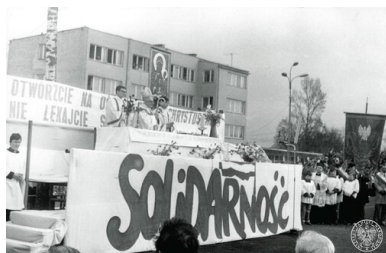
Msza św. polowa z udziałem działaczy NSZZ „Solidarność”, wiosna 1981 r.

„Solidarności” wspomniana zbieżność poglądów i wpływ Kościoła były bardzo wyraźne i czytelne.