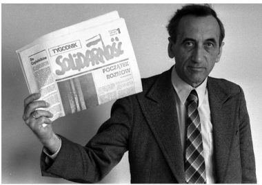
Tadeusz Mazowiecki

Atmosfera panująca w barze zaczynała przypominać ostatnie chwile rejsu „Titanica”.