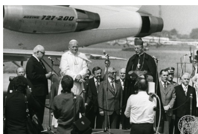
Powitanie Jana Pawła II na lotnisku w Warszawie, 2 czerwca 1979 r. Na lewo od papieża stoi kard. Stefan Wyszyński.