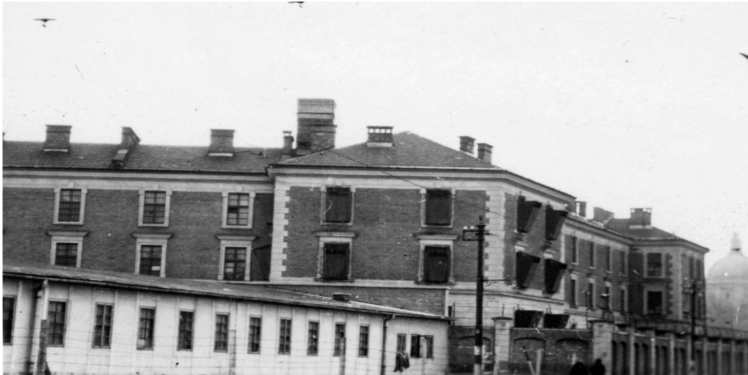
Budynek więzienia prz ul. Montelupich w Krakowie

https://przystanekhistoria.pl/pa2/tematy/sport/101917,Najwazniejszy-skok-w-zyciu-Ucieczka-Stanislaw-Marusarza-z-wiezienia.html