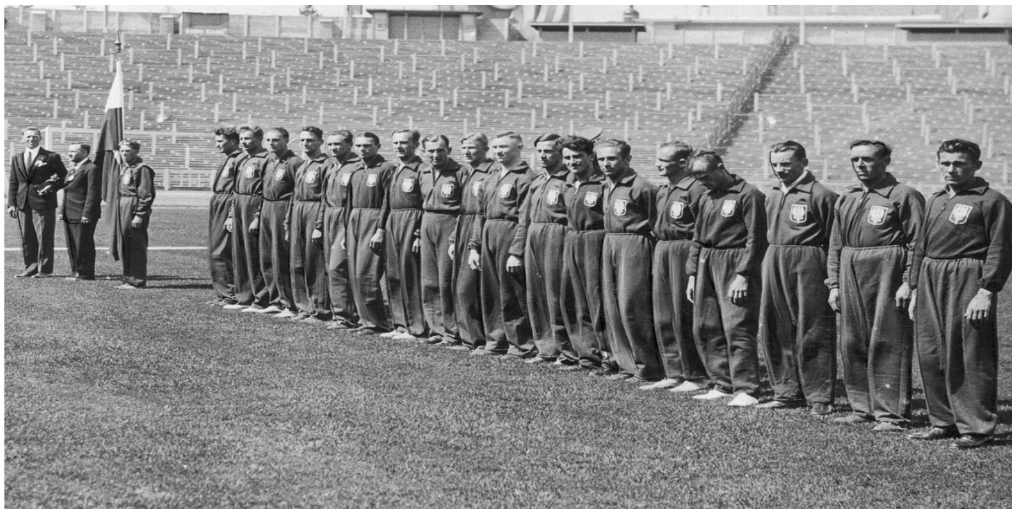
Eugeniusz Lokajski w składzie reprezentacji Polski podczas meczu lekkoatletycznego Belgia - Polska w Brukseli, lipiec 1935 r.

https://przystanekhistoria.pl/pa2/tematy/sport/102546,Portrecista-powstania-Eugeniusz-Lokajski.html