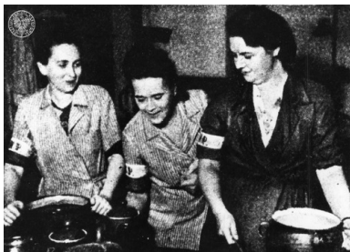
Powstańcza kuchnia polowa.