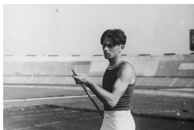
Eugeniusz Lokajski podczas przedolimpijskich zawodów lekkoatletycznych w Warszawie, czerwiec 1936 r.

Eugeniusz Lokajski przed wojną był sportowcem. Odnosił sukcesy jako wszechstronny lekkoatleta. Początkowo startował w zawodach pięcioboju i dziesięcioboju. W 1935 r. zdobył srebrny medal w pięcioboju na mistrzostwach świata w Budapeszcie. Spróbował wszystkiego, aby ostatecznie znaleźć dyscyplinę, w której był najlepszy. W 1936 r. ustanowił rekord Polski w rzucie oszczepem i wystartował w tej konkurencji na olimpiadzie w Berlinie. Na treningu przed zawodami olimpijskimi uzyskał rezultat 73,27 m, co było trzecim, wynikiem na świecie. Niestety kontuzja uniemożliwiła Lokajskiemu zdobycie wtedy medalu.