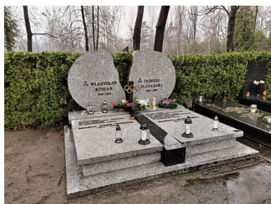
Wspólna mogiła Władysława Komara i Tadeusza Ślusarskiego na Cmentarzu Wojskowym na Powązkach w Warszawie

Zginął 17 sierpnia 1998 r. w wypadku samochodowym razem z innym sportowcem – Tadeuszem Ślusarskim – mistrzem olimpijskim z Montrealu 1976 w skoku o tyczce.