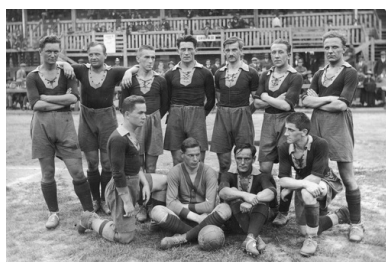
Drużyna piłkarska klubu