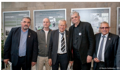
Wernisaż wystawy „I nazywali to Wojskiem Polskim...! Wojskowe Obozy Internowania w Polsce (1982-1983)...” - Warszawa, 8-13 listopada 2017.