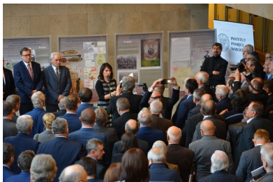
Wernisaż wystawy „I nazywali to Wojskiem Polskim...! Wojskowe Obozy Internowania w Polsce (1982-1983)...” - Warszawa, 8-13 listopada 2017.