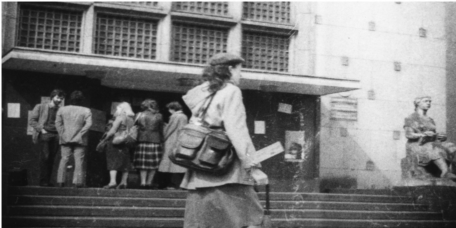
Obserwacja grupy osób przy wejściu do budynku Wydziału Filologicznego Uniwersytetu Śląskiego na ul. Bando obecnie ul. Żytnia w Sosnowcu.

https://przystanekhistoria.pl/pa2/tematy/stan-wojenny/76885,Czerwone-slaskie-uczelnie.html