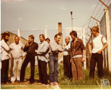
Zakład internowania w Nowym Łupkowie, lato 1982.

Na rozmowy z internowanymi przyjeżdżali także funkcjonariusze Wydziałów III KW MO właściwych dla miejsc ich zamieszkania przed internowaniem bądź przedstawiciele Departamentu III MSW, jeśli ośrodek był pod szczególnym nadzorem Ministerstwa Spraw Wewnętrznych, jak w przypadku Jaworza czy Głębokiego. Przypadki nieobecności funkcjonariuszy SB, najwyżej dwudniowej, zdarzały się wyłącznie sporadycznie i związane były z potrzebą przedstawienia rezultatów pracy w macierzystych KW MO. Faktyczną władzę w ośrodkach odosobnienia sprawowali zatem nie komendanci tych ośrodków, a Służba Bezpieczeństwa.