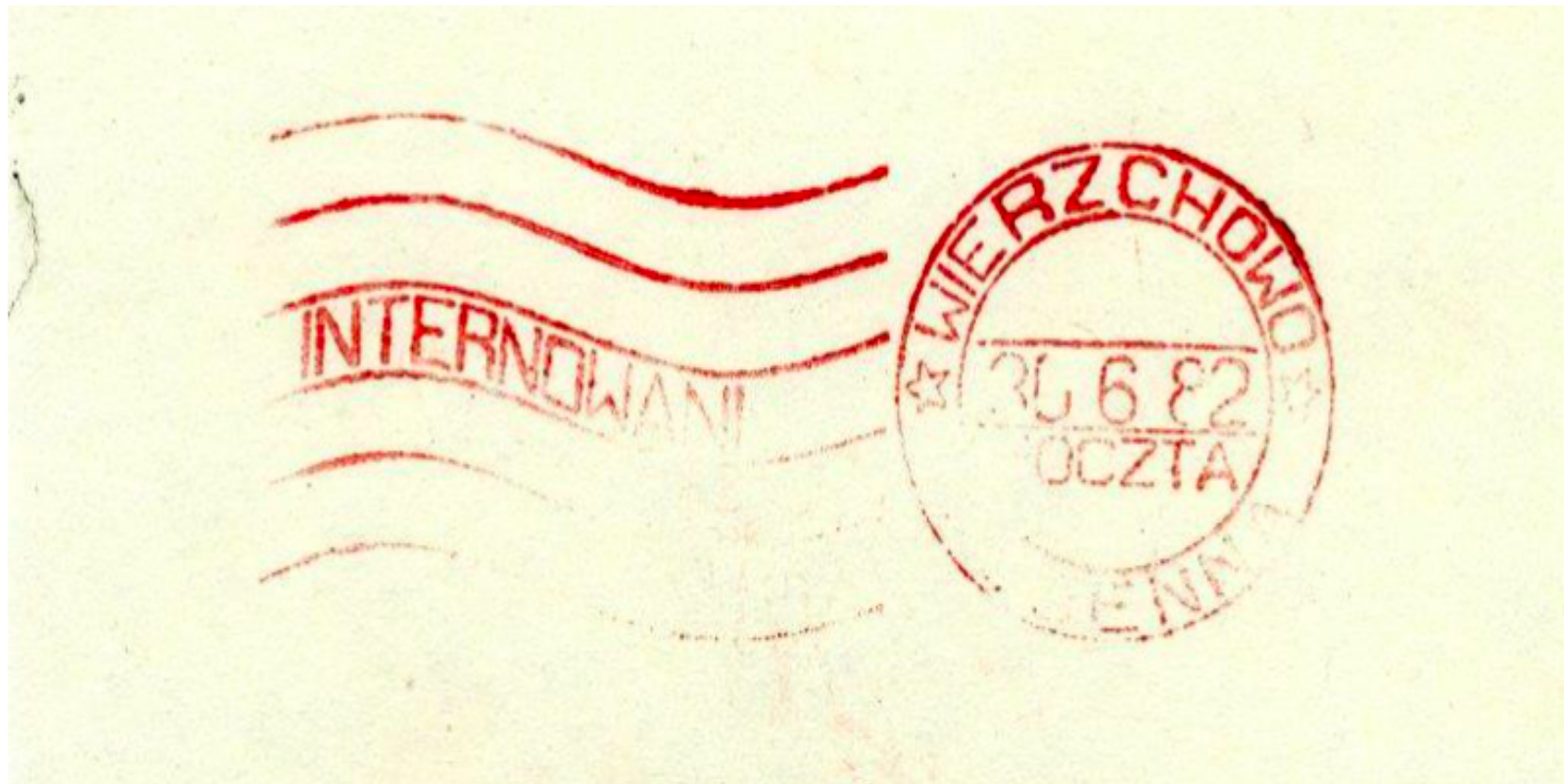
Poczta internowanych - Wierzchowo Pomorskie. Frankatura: "Internowani Wierzchowo 30.6.82 Poczta Wojenna"

https://przystanekhistoria.pl/pa2/tematy/stan-wojenny/89344,Pobicie-internowanych-w-Wierzchowie-Pomorski-m.html