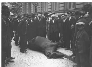
Grupa przechodniów podczas oglądania na ulicy zabitego konia, maj 1926