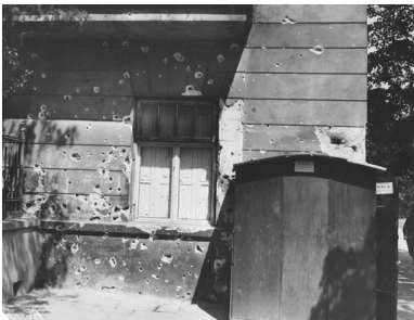
Uszkodzona ściana kamienicy przy Alejach Ujazdowskich 9. Widoczne ślady po ostrzale z karabinu maszynowego, maj 1926

Na moście Poniatowskiego Piłsudski pojawił się około 16.00, tam oczekiwał nań prezydent. Spotkanie zakończyło się fiaskiem. Wojciechowski zaproponował Piłsudskiemu powrót na drogę legalną, co oznaczało przyznanie się do porażki. Co gorsza Marszałek usłyszał, że to właśnie prezydent stoi na straży honoru armii i przekonał się naocznie, że żołnierze gotowi są wymierzyć broń w niego samego. Skoro zaś Piłsudski kapitulować nie zamierzał, pozostawała mu już tylko orężna walka.