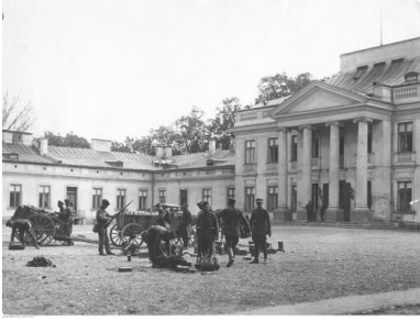
Grupa żołnierzy marszałka Józefa Piłsudskiego na placu przed Belwederem, maj 1926