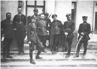
Oficerowie marszałka Józefa Piłsudskiego na schodach przed Belwederem, maj 1926