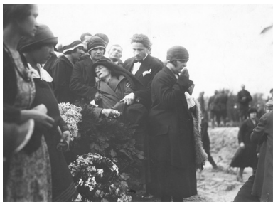
Członkowie rodziny jednej z ofiar przewrotu majowego pogrążeni w żałobie, maj 1926

Realną szansę na sforsowanie Wisły dawało jedynie przejście Trzeciego Mostu (Poniatowskiego), ale Marszałek nie chciał brać na siebie odpowiedzialności za użycie siły. Podległe mu oddziały dostały rozkaz zakazu otwierania ognia aż do chwili, gdy uczynią to żołnierze strony przeciwnej. Powściągliwość zamachowców sprawiła, że przez Trzeci Most mogła przejść Szkoła Podchorążych, wzmacniając tym samym siły rządowe, natomiast próbę jego sforsowania, podjętą przez pododdział Oficerskiej Szkoły Piechoty, powstrzymała „krótka seria w górę z ckm, ustawionego na wieżyczce mostu”. Były to pierwsze strzały, które padły 12 maja. Nie kierowano ich jednak w stronę przeciwnika. Do krwawego starcia, pierwszego podczas zamachu, doszło na Nowym Zjeździe, ogień otwarli zaś żołnierze strony rządowej.