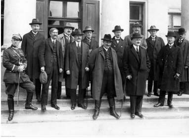
Gabinet Wincentego Witosa, 11 maja 1926 r.