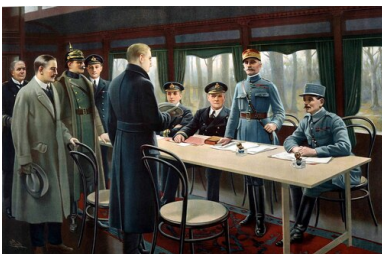
Podpisanie rozejmu w Compiègne w 1918 r. (marsz. Ferdynand Foch drugi z prawej).

Taktyka ta powodowała jednak znaczne straty, stąd w kolejnym okresie Wielkiej Wojny Foch został odsunięty od dowodzenia.