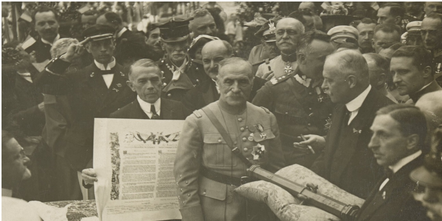
Ferdynand Foch w Warszawie, 1923 r.

https://przystanekhistoria.pl/pa2/tematy/stanislaw-wojciechowski/93448,Wrog-Niemiec-przyjaciel-Polakow.htm