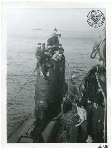
Niemiecki okręt podwodny U-2329 przy burcie brytyjskiego holownika Masterful podczas przygotowań do operacji holowania w zatoce Loch Ryan 26

U-Booty doprowadzane były do okrętów holujących przez niemieckich lub brytyjskich marynarzy. Po zakończeniu przygotowań załogi wracały na ląd (Niemcy trafiali do obozów jenieckich), a pusty okręt ciągnięto na wyznaczone miejsce.