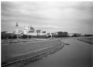
Pińsk, panorama miasta z widokiem na Pińkę, 1936.

Należy również wspomnieć o tych, którzy tragicznie stracili życie, pomordowani w niemieckich obozach koncentracyjnych, zamęczeni w więzieniach NKWD lub na Syberii, rozstrzelani w Mokranach, Mielnikach, Katyniu, Charkowie. Szczątki wielu z nich do dziś spoczywają w bezimiennych dołach śmierci. Pamięć o nich przetrwa tak długo, jak będziemy ich wspominać. Jesteśmy im to winni.