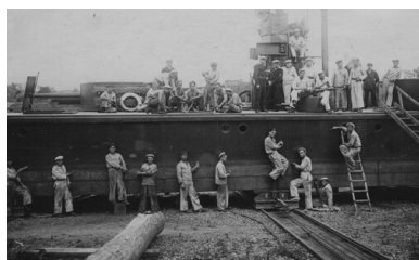
Załoga monitora rzeczno ORP „Horodyszcz” czyści kadłub statku w suchym doku w Modlinie, 1925.