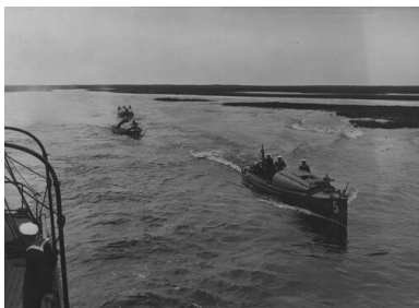
Motorówki Flotylli Pińskiej na Pynie, okres Drugiej Rzeczypospolitej.

Pińsk ponownie znalazł się w polskich rękach we wrześniu 1920 r. Rozpoczął się proces reaktywowania Flotylli Pińskiej. Z wód Piny i Prypeci podniesiono zatopione statki i motorówki. Dowódca Flotylli Wiślanej utworzył w Pińsku Oddział Detaszowany Flotylli Wiślanej* na Prypeci, któremu polecono patrolowanie granicy, zwalczanie bandytyzmu, służbę transportową, walkę z dywersantami oraz podnoszenie zatopionego taboru. Odbudowano Warsztaty Portowe Marynarki Wojennej, a 10 lutego 1921 r. odtworzono Komendę Portu Wojennego.