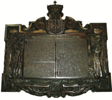
Tablica pamiątkowa z tekstem Ślubów króla Jana Kazimierza w Sali Rycerskiej bazyliki na Jasnej Górze

Jesienią 1956 r. władze stanęły w obliczu kryzysu społeczno-politycznego, który groził trudnymi do przewidzenia konsekwencjami. Na scenę polityczną powrócił Władysław Gomułka, odsunięty wcześniej w wyniku walk frakcyjnych i aresztowany w 1951 r. Podczas obrad VIII Plenum Komitetu Centralnego PZPR w październiku 1956 r. został on wybrany na I sekretarza KC. W pierwszych oficjalnych wystąpieniach unikał tematów związanych z sytuacją Kościoła w państwie, jednak wypadki zachodzące w kraju kazały mu zrewidować dotychczasowe stanowisko władz.