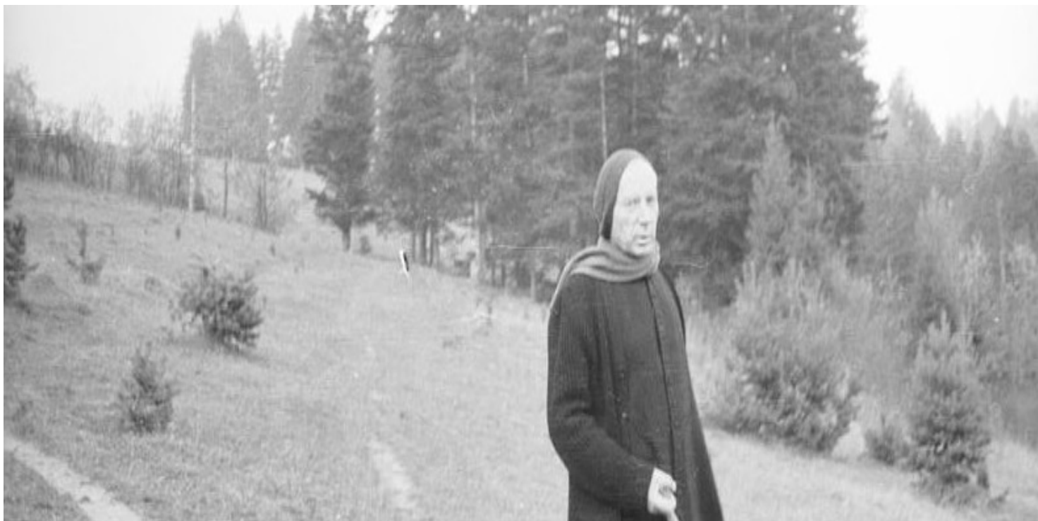
Prymas Wyszyński podczas internowania w Komańczy

https://przystanekhistoria.pl/pa2/tematy/stefan-wyszynski/86095,Nieobecnośc-Prymasa.html