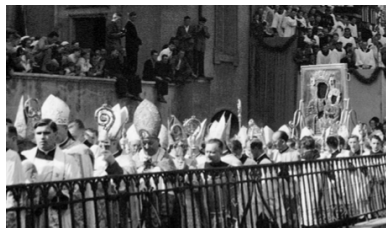
Cudowny Obraz Matki Boskiej Częstochowskiej wyniesiony na Wały Jasnogórskie, 26 sierpnia 1956 r.

Członkowie Biura Politycznego przyjęli uchwałę, która sankcjonowała powrót Prymasa na „poprzednie stanowisko”. Kardynał Wyszyński wyjechał z Komańczy 28 października 1956 r. Jego uwolnienie było wpisane w kontekst przemian październikowych i zwiastowało nowy etap w relacjach państwa z Kościołem.