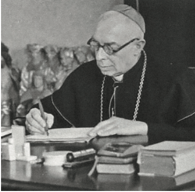
Biskup Kazimierz Kowalski, 1964

Państwo weszło z Kościołem na wojenną ścieżkę, znaczoną m.in. aresztowaniami duchowieństwa, laicyzacją życia społecznego, presją cenzury, likwidacją stowarzyszeń katolickich (sierpień 1949 r.), zawłaszczeniem charytatywnej instytucji Caritas (styczeń 1950 r.), internowaniem bp. Kazimierza Kowalskiego (luty-marzec 1950 r.), przejęciem kościelnych dóbr tzw. martwej ręki (marzec 1950 r.).