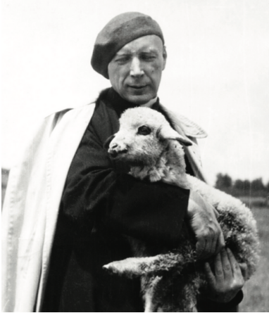
Prymas w Komańczy, 1956 r.

Paradoks sytuacji jesienią 1956 r. polegał na tym, że mimo internowania (decyzja o uwolnieniu hierarchy formalnie jeszcze nie zapadła) Prymas miał w rękach poważne atuty. Od niego w niemałym stopniu zależał rozwój wypadków – albo w kierunku korzystnym dla ekipy Gomułki, albo przeciwnie. Jednocześnie stanął przed dylematem: przyjęcie przez niego decyzji o uwolnieniu było bowiem, chcąc nie chcąc, równoznaczne z pewnym gestem wobec komunistycznego państwa, co z punktu widzenia władz miało walor propagandowy.