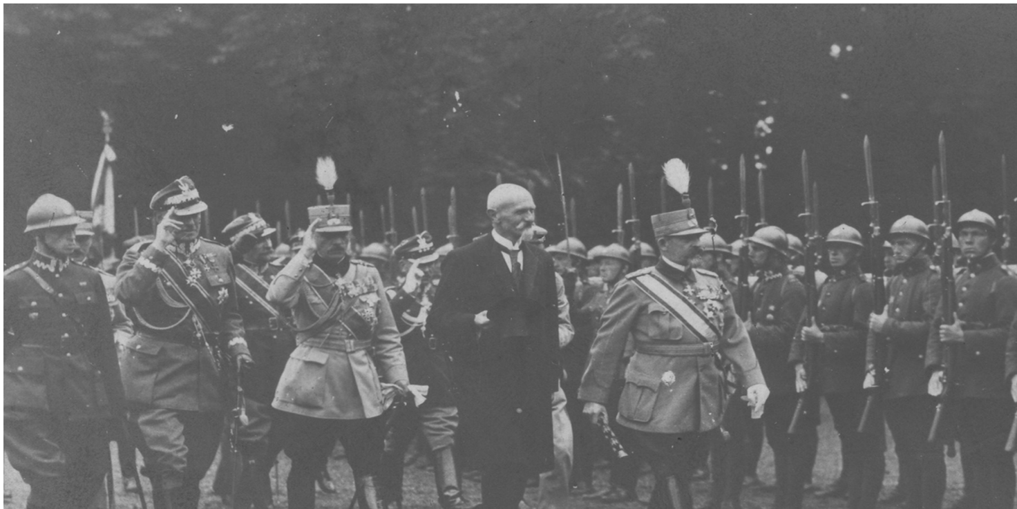
Prezydent RP Stanisław Wojciechowski i król Rumunii Ferdynand przed oddziałem piechoty Wojska Polskiego.

https://przystanekhistoria.pl/pa2/tematy/stosunki-miedzynarodowe/104472,Wizyta-rumunskiej-pary-krolewskiej-w-Polsce-w-1923-roku.html