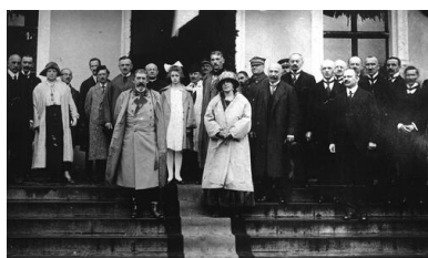
Rumuńska para królewska przed Szybem Daniłowicza w Wieliczce.