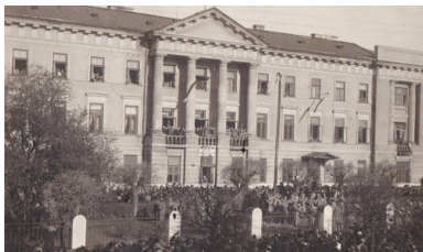
Ogłoszenie Aktu 5 listopada z balkonu Pałacu Sandomierskiego w Radomiu