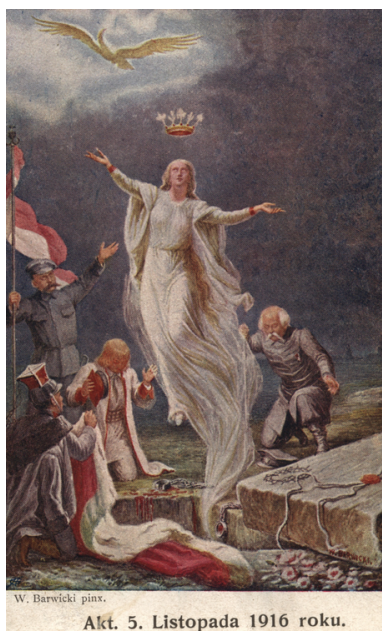
Akt. 5. Listopada 1916 roku.