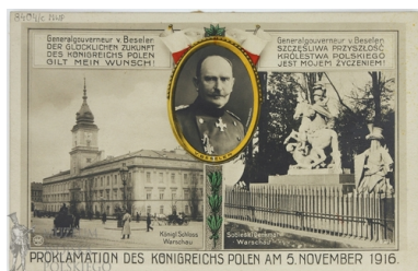
Kartka pocztowa z okazji proklamowania Aktu 5 listopada