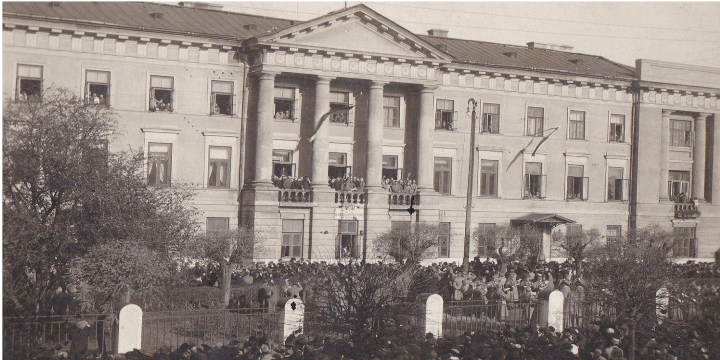
Ogłoszenie Aktu 5 listopada z balkonu Pałacu Sandomierskiego w Radomiu

https://przystanekhistoria.pl/pa2/tematy/stosunki-miedzynarodowe/51598,Akt-5-listopada-przelom-w-czasie-wielkiej-wojny.html