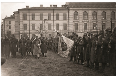
Przegląd wojska dokonany przez Naczelnika Państwa Józefa Piłsudskiego po zajęciu Wilna. Kwiecień 1919 r.