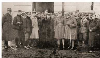
Komisja Ligi Narodów w koszarach wileńskich. 1919 r.

Litwini nie rezygnowali z północnej części powiatu suwalskiego, gdzie m.in. w Wiżajnach i Andrzejewie przystąpili do likwidacji polskich instytucji. Stan okupacji litewskiej budził zaniepokojenie wśród mieszkających tam Polaków, zwłaszcza że Litwini zamierzali przejąć całą administrację wojskową i cywilną. Z nastrojów ludności doskonale zdawało sobie sprawę kierownictwo Suwalskiego Okręgu Polskiej Organizacji Wojskowej (POW), które postanowiło wykorzystać je w antylitewskiej akcji zbrojnej. 16 sierpnia zapadła decyzja o wybuchu powstania sejneńskiego, którego celem było odzyskanie Sejna i obszaru do wyznaczonej linii Focha. Jako termin jego rozpoczęcia wybrano noc z 22 na 23 sierpnia. W wyniku działań powstańczych, prowadzonych w dniach 23–28 sierpnia przez oddziały POW wsparte przez II batalion 41. Suwalskiego Pułku Piechoty, wojska litewskie zostały wyparte z rejonu Sejna. Do 9 września oddziały polskie wyparły Litwinów za linię Focha.