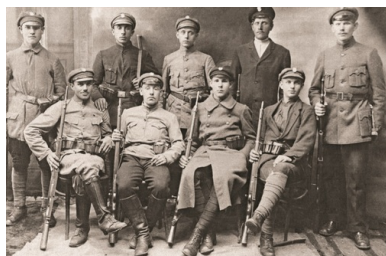
Drużyna POW z Suwałk. 1919 r.