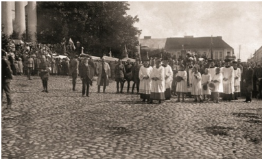
Pogrzeb poległych powstańców sejneńskich. Kondukt żałobny z trumnami poległych przed kościołem św. Aleksandra w Suwałkach. 28 sierpnia 1919 r.

Zajęta przez oddziały polskie linia została ponownie potwierdzona 8 grudnia 1919 r. przez Radę Najwyższą państw Ententy jako północny odcinek granicy terenu bezspornie przyznanego Polsce. Należy w tym miejscu przypomnieć, że na skutek zdecydowanego stanowiska polskich mieszkańców Wisztyńca i Lubowa oraz pobliskich im okolic, na podstawie polsko-litewskich ustaleń w Czerwonce (6 września), od września 1919 do lipca 1920 r. obie miejscowości należały do Polski i administracyjnie przydzielone były do powiatu suwalskiego. Latem 1920 r. ruszyła ofensywa Armii Czerwonej, zmuszając oddziały polskie do wycofania się. W lipcu 1920 r. na podstawie postanowień rosyjsko-litewskiego traktatu pokojowego zawartego w Moskwie Wileńszczyzna i Grodzieńszczyzna miały zostać przekazane Litwie. Ponadto, wobec odwrotu wojsk polskich, Litwini naruszając