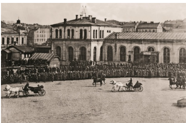
Przyjazd Naczelnika Państwa Józefa Piłsudskiego do Wilna. Powitanie na dworcu kolejowym. Kwiecień 1919 r.

ochotniczym (Freikorps). Z początkiem 1919 r. władze niemieckie wyraźnie jednak zaostrzyły swoją politykę w stosunku do polskiego samorządu, otwarcie wspierając litewskie roszczenia terytorialne. Dzięki temu Litwini usunęli z Sejm polskiego naczelnika i 15 stycznia powołali Litewski Komitet Powiatowy, który kontrolował cały powiat sejneński oraz północno-wschodnią część powiatu suwalskiego wraz z Puńskiem. W styczniu 1919 r. został utworzony litewski oddział milicji, który został uzbrojony w broń odkupioną od Niemców. Aby wymusić wykonywanie poleceń władz litewskich, milicja aresztowała kilku polskich urzędników i usiłowała zastraszyć pozostałych. Pod koniec marca szef niemieckiego zarządu w Suwałkach poinformował przedstawicieli Rady o przekazaniu Suwałk i m.in. powiatu suwalskiego i augustowskiego Litewskiej Radzie Państwowej (Taryba), która została uznana przez władze niemieckie za suwerenną władzę na terenie byłego gubernatorstwa litewskiego. Z początkiem maja do Suwałk wkroczyły oddziały litewskie, a na początku lipca przybyli pierwsi urzędnicy litewscy, którzy usiłowali przejąć administrację powiatu i tworzyć własne instytucje.