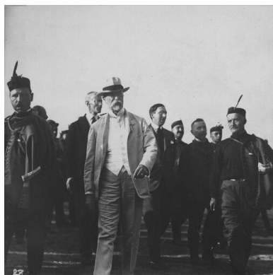
Prezydent Czechosłowacji Tomáš Masaryk na zjeździe Sokolstwa w 1920 r.

Władze I Republiki liczyły się z upadkiem Polski, o czym świadczy opracowanie tzw. planu „B” (bolszewicy) zakładającego obsadzenie granicy z Polską wojskiem i konieczność przyjęcia fali polskich uchodźców, którzy mieli być rozsielani na terytorium ČSR. Rząd Republiki tolerował manifestacje poparcia dla bolszewików, które miały miejsce zwłaszcza 19 sierpnia 1920 r.