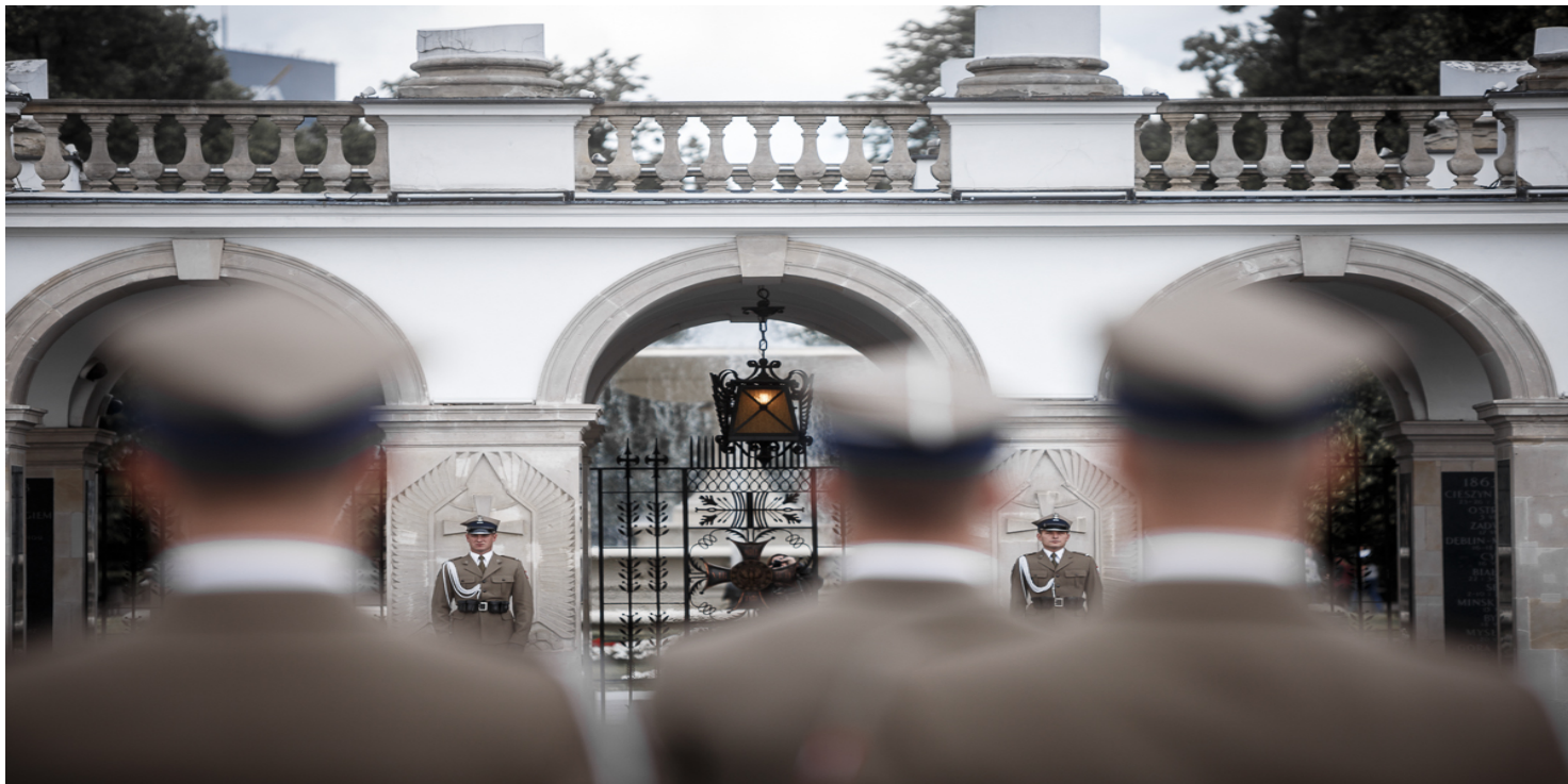
Wojna polsko-czechosłowacka w dniach 23-30 stycznia 1919 roku i bitwa pod Skoczowem zostały upamiętnione na jednej z tablic Grobu Nieznanego Żołnierza w Warszawie.

https://przystanekhistoria.pl/pa2/tematy/stosunki-miedzynarodowe/71808,Czechoslowacja-wobec-wojny-polsko-bolszewickiej-w-1920-r-i-kwestii-granicy-z-Pol.html