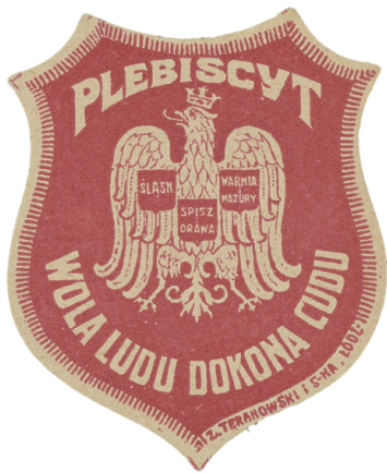
Odnaka kwestarska "Plebiscyt Wola ludu dokona cudu - Śląsk Spisz i Orawa Warmia i Mazury"

znalazły się północno-wschodnia Orawa i północno-zachodni Spisz. Ogólnie Polsce przypadły 1002 z 2220 km 2 i 142 z 435 tys. ludności Śląska Cieszyńskiego. Czechosłowacja otrzymała okręg przemysłowy i 100 tys. ludności polskiej. Na Spiszu i Orawie 27 wsi z 30 tys. ludności mocarstwa przyznały Polsce, zaś pod władzą Pragi znalazły się 44 wsie zamieszkiwane przez 40 tys. ludzi. Ententa przy podziale terytorium brała pod uwagę w większym stopniu niż skład narodowy ludności linię wpływów kapitału francuskiego i granicę majątków hrabiów Larisch.