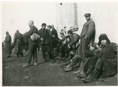
Raj - Stalina... Po amnestji - zbieramy się do kupy (z odwrócia fotografii).

Oczywiście twierdzenie, że „wszyscy” Polacy zostali zwolnieni, było dalekie od prawdy: jednym z ważniejszych obszarów działalności polskiej Ambasady w ZSRS była walka o pełną