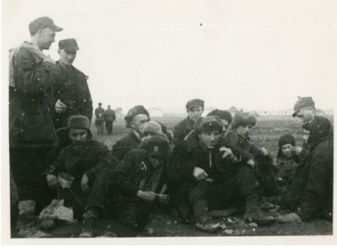
Raj - Stalina... Po "amnestji" (z odwrócia fotografii). Uwolnieni z łagrów sowieckich po przybyciu do Armii gen. Andersa, grudzień 1941 r.