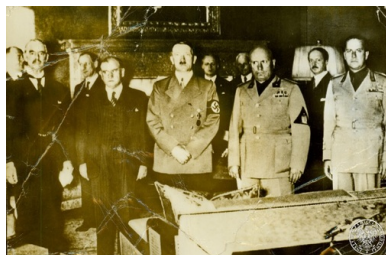
Fotokopia zdjęcia z podpisania układu z Monachium 29-30 IX 1938 r. W pierwszym rzędzie od lewej Neville Chamberlain, Edouard Daladier, Adolf Hitler, Benito Mussolini, Galeazzo Ciano.

Zarzut udziału w rozbiore Czechosłowacji dokonanym jesienią 1938 r. jest jednym z trwałych elementów narracji historycznej wymierzonej w Polskę. Decyzja o podziale terytorium I Republiki zapadła 29 września podczas konferencji w Monachium z udziałem Francji, Niemiec, Wielkiej Brytanii i Włoch. Demokratyczne mocarstwa zachodnie przyjęły pasywną postawę, godząc się na realizację żądań Hitlera. O ostatecznym przebiegu nowych granic miała zdecydować specjalna komisja złożona z przedstawicieli stron umawiających się w stolicy Bawarii oraz ČSR. Uczestnicy konferencji wydali również dodatkowe oświadczenie do zawartego układu, które dotyczyło mniejszości polskiej i węgierskiej w Czechosłowacji. W przypadku braku kompromisu w tych kwestiach zapowiedziano po trzech miesiącach zorganizowanie ponownego spotkania monachijskiej czwórki.