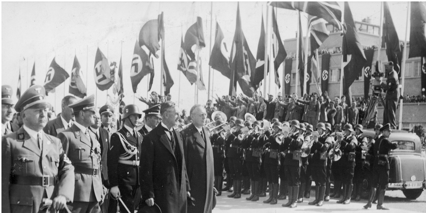
Przybycie premiera Wielkiej Brytanii Neville'a Chamberlaina na konferencję czterech mocarstw w Monachium, 29-30 września 1938 r.

https://przystanekhistoria.pl/pa2/tematy/stosunki-miedzynarodowe/76231,Udzial-Polski-w-rozbiorze-Czechoslowacji-falszywa-klisza-antypolskiej-opowieści.html