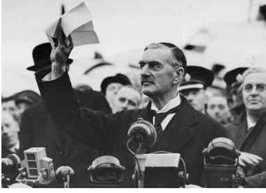
Premier Wielkiej Brytanii Neville Chamberlain przemawia na lotnisku Heston do zgromadzonej publiczności, na temat układu podpisanego w Monachium, 30 września 1938 r.