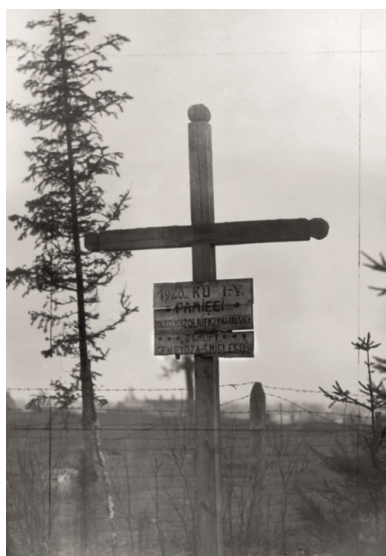
Zbiorowa mogiła żołnierzy polskich w Dyneburgu, październik 1931 r.

Przeciwnikiem była 15. Armia Rosji Sowieckiej w Łatgalii, która liczyła 26 tys. bagnatów, 600 szabel i 180 dział. Oddziały armii łotewskiej 1 stycznia 1920 r. zajęły pozycje od Kazimire, u ujścia Dubny, do Dźwiny przy miejscowości Dignāja (1,8 tys. żołnierzy z 3. Pułku), a dalej na północ – do stacji kolejowej Atašiene (2,1 tys. niemieckich gwardzistów narodowych). Na front przybył 1 stycznia łotewski 9. Pułk Piechoty (1,8 tys. żołnierzy). Wojsko Polskie zajmowało zaś front wzdłuż Dźwiny od Połocka do Dyneburga. Od linii kolejowej Dyneburg – Wilno do miejscowości Laši stacjonowała grupa turmoncka, a od Laši do Geitviniški – grupa uderzeniowa (w 1. Pułku grupy 1 stycznia było 50 oficerów i 2798 żołnierzy, a w 5. Pułku – 2518 ludzi), dalej była grupa prawego skrzydła (7., 8. i 9. Pułki Legionów). Między siłami łotewskimi i polskimi wzdłuż Dźwiny (od Kazimire do Grzywy) dwudziestokilometrowy front zajmowała armia litewska.