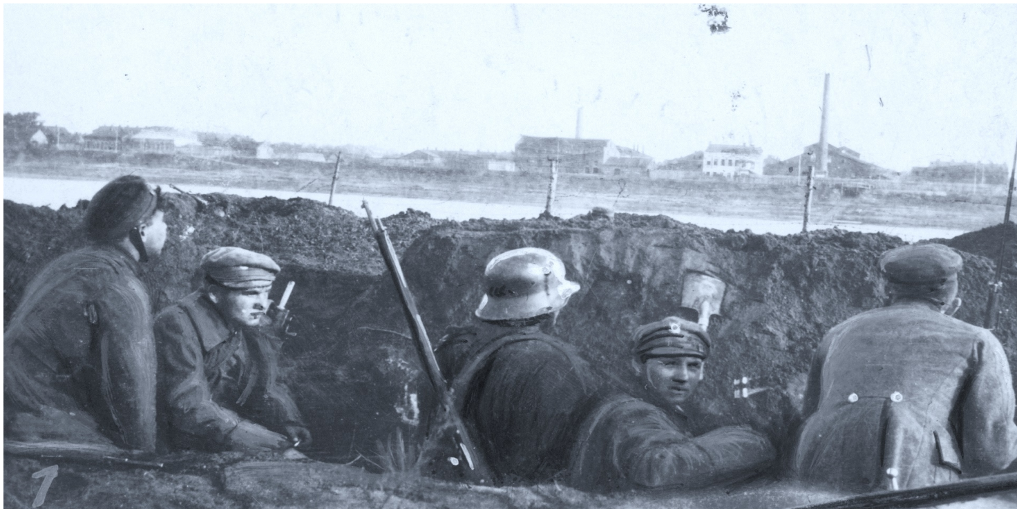
Żołnierze w okopie na przyczółku mostowym w Dyneburgu, październik 1919 r.

https://przystanekhistoria.pl/pa2/tematy/stosunki-miedzynarodowe/77443,Operacja-Zima-Wspolpraca-polsko-lotewska-w-wyzwoleniu-Latgalii.html