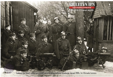
Łotewscy (po lewej) i polscy (po prawej) żołnierze po wyzwoleniu Dyneburga, styczeń 1920 r.

Już 2 grudnia Naczelnik Państwa Józef Piłsudski wydał instrukcję w sprawie operacji łatgalskiej, nadając jej kryptonim „Zima”. Dalsze wydarzenia zależały od działań wojskowego przedstawiciela Polski w stolicy Łotwy – kpt. Aleksandra Myszkowskiego. Przybył on do Rygi i w dniach 16–17 grudnia uzgodnił z gen. Pēterisem Radziņšem, szefem Sztabu Naczelnego Wodza armii łotewskiej, rozpoczęcie ofensywy. Strony zgodziły się zachować przygotowania w tajemnicy.