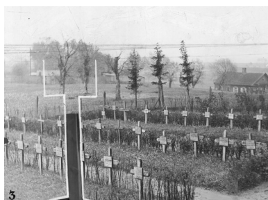
Groby polskich żołnierzy poległych w walkach o Dyneburg