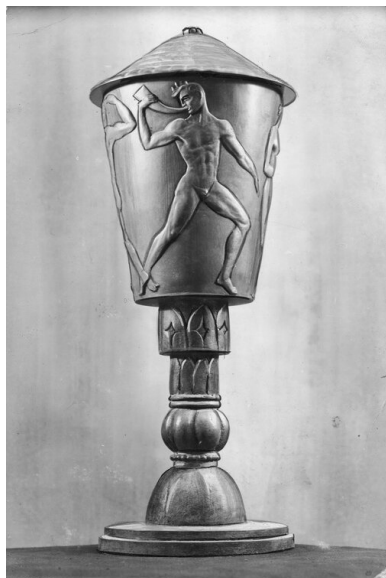
Puchar dla najlepszej drużyny mistrzostw ufundowany przez

Ponadto mieli oni wprowadzać do sportowej rywalizacji „element nacjonalistyczny”. Potwierdzenie tej tezy stanowił sposób gry w meczu z Węgrami, określony mianem „zwyczajnego, karczemnego łobuzerstwa”.