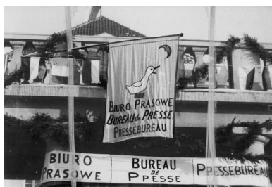
Siedziba Biura Prasowego obsługującego mistrzostwa świata w hokeju na lodzie w Krynicy, 1-8 lutego 1931 r.

Polskie władze przykładały ogromną wagę do przygotowań organizacyjnych i sportowych. Świadczyło o tym zbudowanie naturalnego lodowiska ze sztucznym oświetleniem oraz z częściowo krytymi dachem trybunami, na których zamontowano nawet centralne ogrzewanie. Odpowiedni poziom sportowy polskiej ekipy miał zapewnić nowo zatrudniony kanadyjski trener. Przed rozpoczęciem turnieju z zachwytem pisano m.in. o hokeistach czechosłowackich i nic nie zapowiadało wydarzeń, do których doszło kilkanaście dni później.