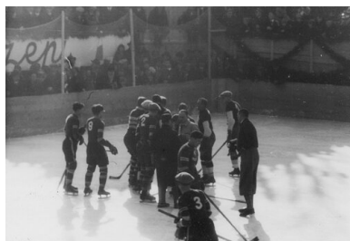
Dyskusja zawodników Polski i Czechosłowacji.

Oglądający spotkanie przedstawiciele poselstwa ČSR w Warszawie odnieśli wrażenie, że zachowanie publiczności miało charakter zorganizowanej kampanii. Kibiców nie potrafili uspokoić organizatorzy mistrzostw, tłumacząc swą bezradność faktem uszkodzenia megafonu, co uniemożliwiało zapanowanie nad rozentuzjasmowanym tłumem.