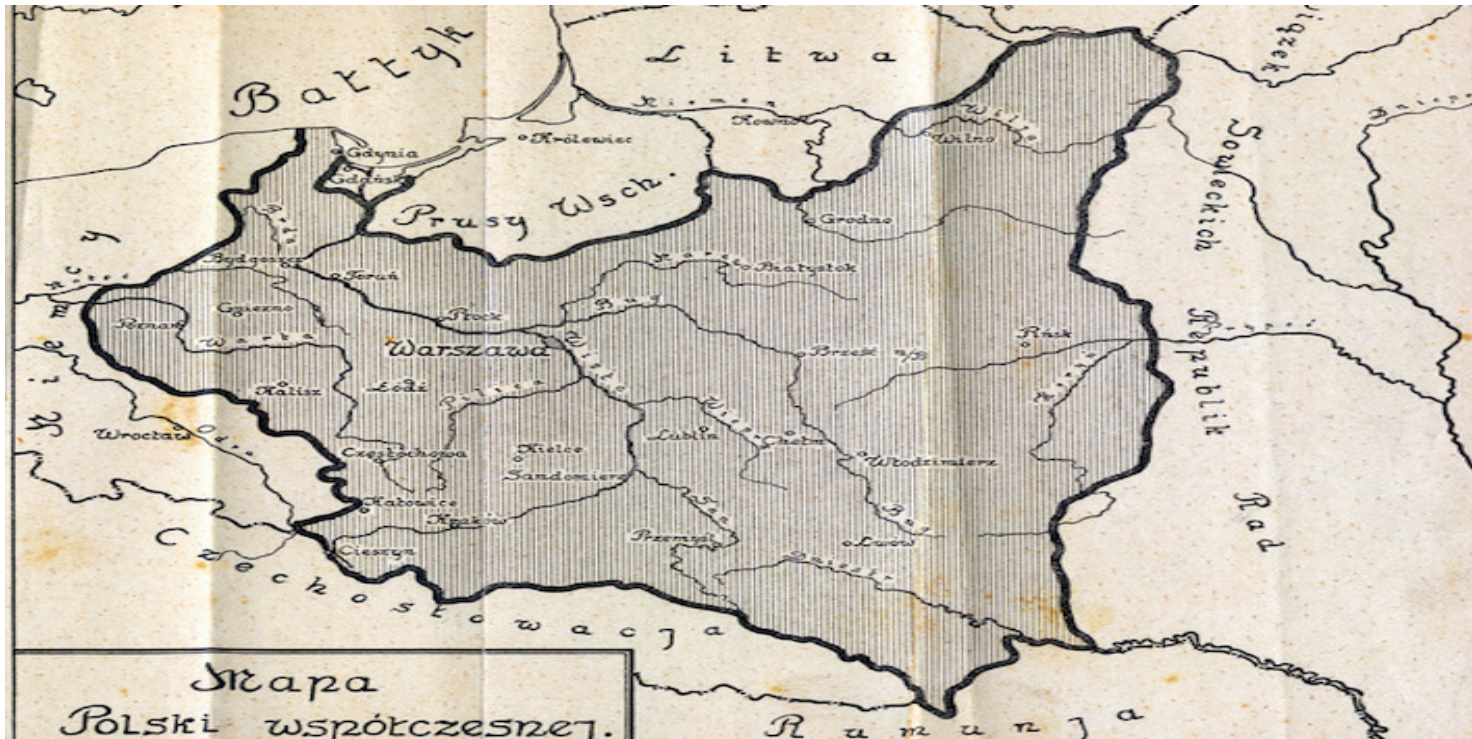
Granice II Rzeczypospolitej

https://przystanekhistoria.pl/pa2/tematy/stosunki-miedzynarodowe/81533,Polityka-wschodnia-Jozefa-Pilsudskiego-w-latach-1918-1920.html