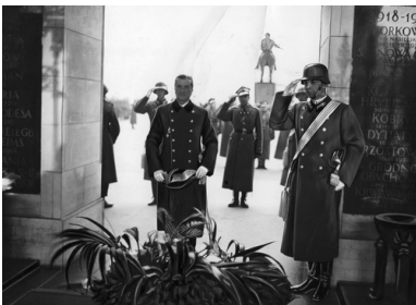
Regent Węgier Miklos Horthy podczas wizyty w Polsce składa wieniec na Grobie Nieznanego Żołnierza w Warszawie. Za nim

„Pierwotna nieokiełznana radość nad porażkami polskimi ustępuje miejsce troskom, jakie konsekwencje mieć może dalsze posuwanie się wojsk rosyjskich dla państwa czeskiego” 35 .