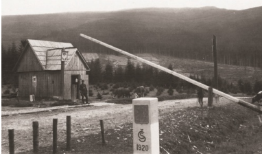
Granica z Czechosłowacją. Przejście graniczne Korbielów- Orawska Półgóra - 1925 r.

W okresie największego zagrożenia Rzeczypospolitej bolszewicką nawałą, 9 sierpnia władze Czechosłowacji ogłosiły neutralność wobec toczącej się wojny. Neutralność tę należy określić jako niezyczliwą dla Polski, gdyż poza ciągłym blokowaniem transportów, Czesi latem 1920 r. gościli w Pradze Jewhena Petruszewycza, przedstawiciela Zachodnioukraińskiej Republiki Ludowej planującego wywołanie powstania w Małopolsce Wschodniej 30 . Posunięcia dyplomatyczne Pragi kontrastowały z postawą Budapesztu, o czym świadczyło np. przybycie w tym czasie do Warszawy delegacji parlamentu węgierskiego 31 .