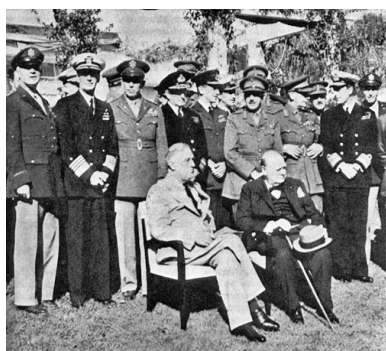
Franklin Roosevelt i Winston Churchill podczas konferencji w Casablance, styczeń 1943 r.

Szala zwycięstwa przechylała się na stronę koalicjantów, nadchodził czas ustalania nowego ładu na świecie po zakończeniu wojny. O jego kształcie i podziale stref wpływów zdecydowała Wielka Trójka: Stalin, Churchill i Roosevelt. W latach 1943-1945 spotkali się dwukrotnie w tym składzie (za trzecim razem zmarłego Roosevelta zastąpił nowy prezydent USA, Harry Truman). Ich decyzje zaważyły na losie nie tylko przegranych państw, lecz także innych, słabszych koalicjantów, takich jak Polska.