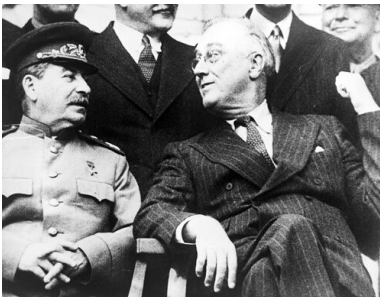
Józef Stalin i Franklin Delano Roosevelt na konferencji w Teheranie, listopad 1943 r.

Stalin, znając zamiary swoich partnerów, umiejętnie podsycił spory między Churchillem a Rooseveltem. Poważnie negocjując, kpł sobie wielokrotnie w sposób dyskretny z brytyjskiego premiera, schlebając przy tym na każdym kroku amerykańskiemu prezydentowi. Do tego stopnia zaskarbił sobie sympatię Roosevelta, że w prywatnych rozmowach po konferencji przywódca USA nazywał go „wujkiem Joe”.