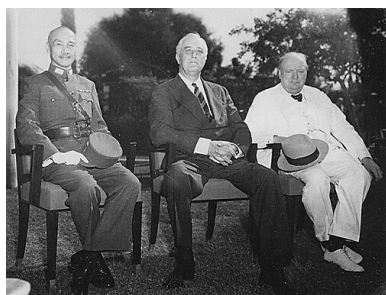
Czang Kaj-szek, Franklin Roosevelt i Winston Churchill.