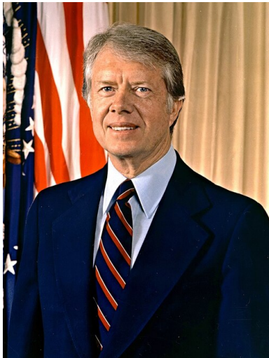
Prezydent USA Jimmy Carter na fotografii z 1977 r. (domena publiczna)

Tego samego 7 grudnia 1980 r. amerykańska administracja napędce przygotowała wraz z europejskimi stolicami (za pomocą serii telegramów) linię postępowania na wypadek ziszczenia się scenariusza inwazji: atak miał implikować zerwanie relacji dyplomatycznych z Moskwą, embargo handlowe oraz zerwanie rozmów rozbrojeniowych. Nie było więc mowy o jakichkolwiek działaniach militarnych, choć wśród luźnych pomysłów pojawiła się nawet propozycja blokady Kuby jako sankcji za akcję radziecką. Realne możliwości działania były ograniczone – znowu nikt nie zamierzał „umierać za Gdańsk”. Istotne było jednak samo zadeklarowanie – co prawda ogólnikowe – jedności reakcji Zachodu w obliczu poczynań ZSRS.