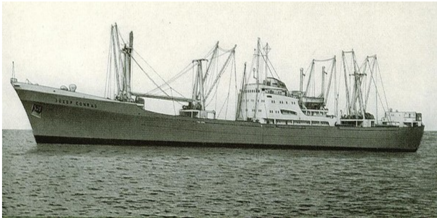
Polski drobnicowiec "Józef Conrad"

https://przystanekhistoria.pl/pa2/tematy/stosunki-miedzynarodowe/92531,Tragedia-zalogi-polskiego-statku-Jozef-Conrad-w-Hajfongu.html