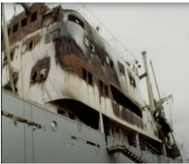
Fragment zniszczonej jednostki

W rzeczywistości Amerykanie zdawali sobie sprawę z faktu zniszczenia polskiej jednostki – Kissinger przyznał to wieczorem 20 grudnia w rozmowie telefonicznej z Nixonem.