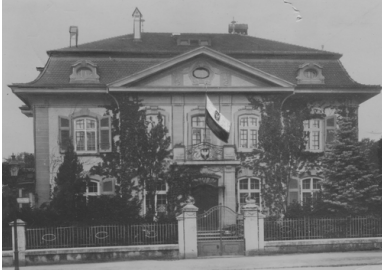
Gmach Poselstwa RP w Bernie