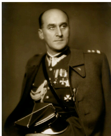
Bronisław Noël

Pomimo braku informacji o niektórych postaciach, w niektórych przypisach zamieszczono informacje o osobach występujących w tekstach depeesz. Niestety, w tych przypisach niekiedy zostały pominięte ważne dla Czytelnika informacje. Dla przykładu - na stronie 73. w przypisie 110. podano, że płk dypl. Bronisław Noël był zastępcą attaché wojskowego w Bernie. Natomiast pominięto informację istotną - w latach 1940-1942 ten oficer był kierownikiem placówki łącznikowej Samodzielnego Wydziału Krajowego (Oddziału VI) Sztabu Naczelnego Wodza w Bernie.