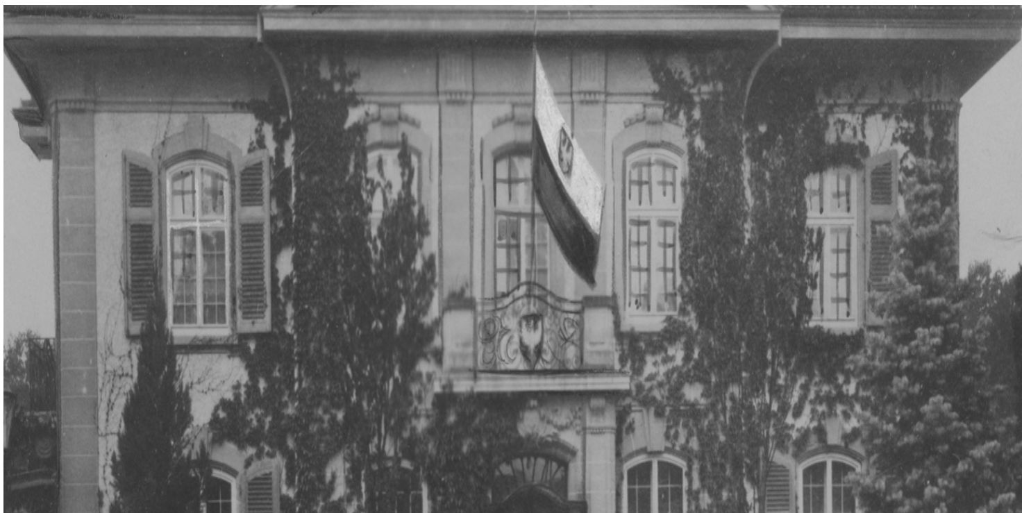
Gmach Poselstwa RP w Bernie

https://przystanekhistoria.pl/pa2/tematy/stosunki-miedzynarodowe/93719,Telegramy-czasu-wojny.html