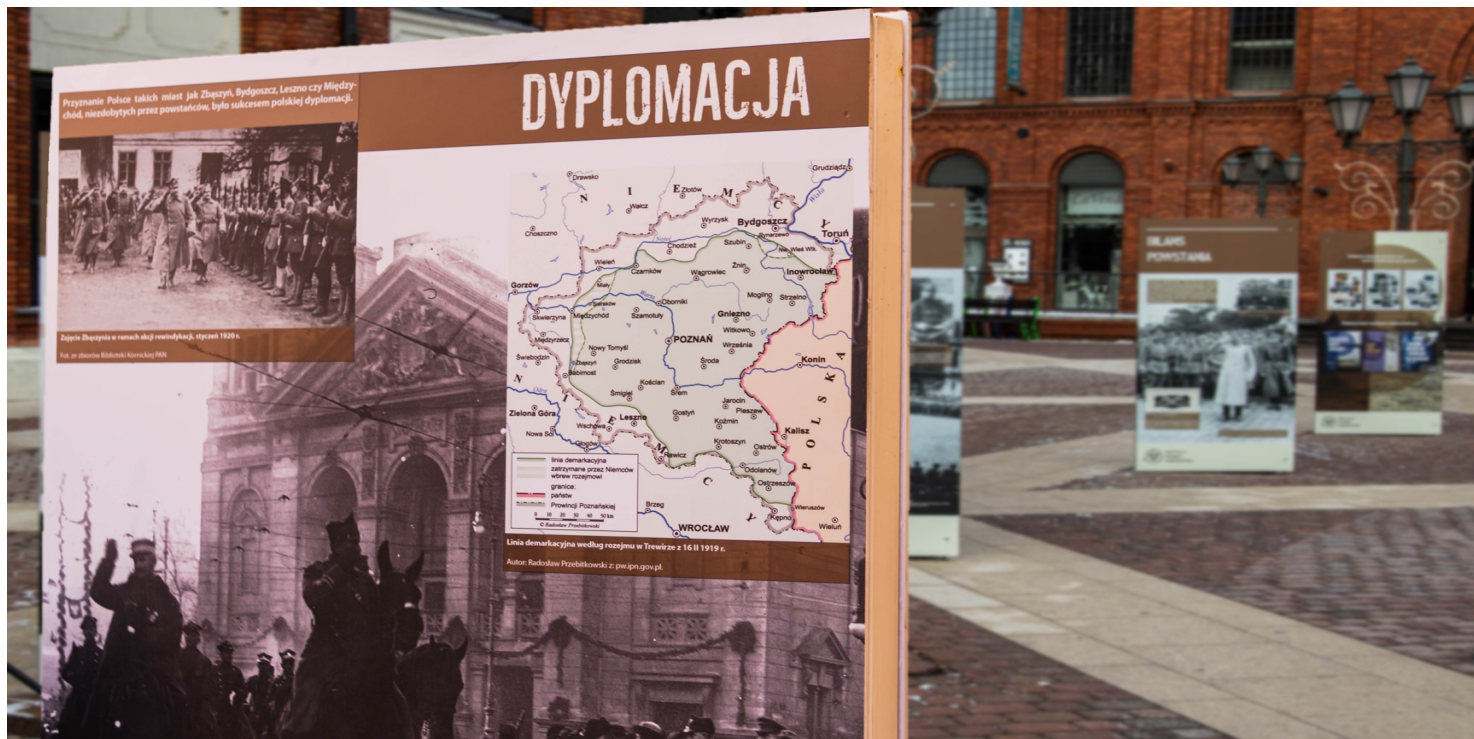
Wystawa IPN „Powstanie Wielkopolskie 1918-1919”

https://przystanekhistoria.pl/pa2/tematy/stosunki-miedzynarodowe/98866,Rozejm-w-Trewirze-Wielkie-zwyciestwo-sprawy-polskiej.html