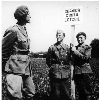
Tablice graniczne dla internowanych w Szwajcarii żołnierzy 2 Dywizji Strzelców Pieszych.

W czasie ferii zarówno żołnierze-studenci, jak i uczniowie, licealiści pracowali fizycznie. Nie mieli dni wolnych od zajęć, poza niedzielami i dniami świątecznymi.