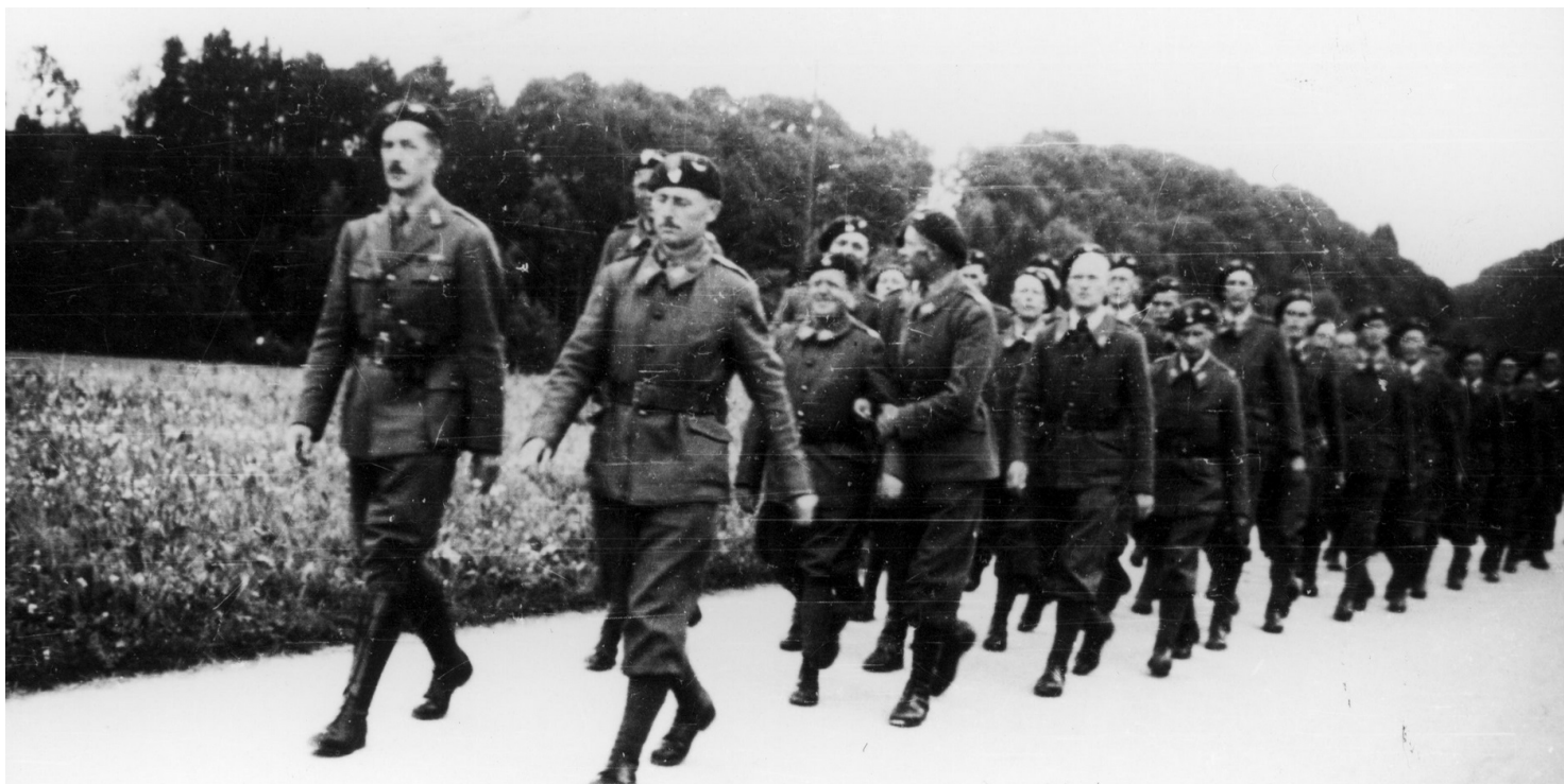
Maszerujące oddziały 2 Dywizji Strzelców Pieszych internowanej w Szwajcarii.

https://przystanekhistoria.pl/pa2/tematy/szwajcaria/73667,Z-ziemi-helweckiej-do-polskiej.html