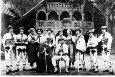
Inscenizacja teatralna przedstawienia "Wesele góralskie" w wykonaniu teatru żołnierskiego 4 Pułku Strzelców Pieszych, internowanego w Szwajcarii.