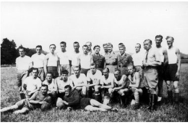
Drużyna piłkarska złożona z żołnierzy 2 Dywizji Strzelców Pieszych, internowanej w Szwajcarii.