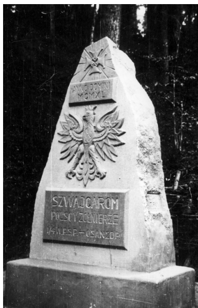
Pomnik wzniesiony przez żołnierzy 2 Dywizji Strzelców Pieszych, internowanej w Szwajcarii.

Żołnierze byli skoncentrowani w obozach na terenie Szwajcarii, a miejsca ich zakwaterowania często się zmieniały. W sumie 1217 miejscowości szwajcarskich stało się siedzibami internowania polskich żołnierzy. Od lipca 1942 roku byli oni rozlokowani w siedmiu sektorach tj.: Argovie, Thur, Seeland, Reuss, Grisons, Rhône, Tessin. Otrzymywali także żołd, którego wysokość była uzależniona od stopnia wojskowego. Na początku mieli zakaz pracy, który został uchylony po wprowadzeniu tzw. Planu Wahlena, mającego na celu osiągnięcie przez Szwajcarów samowystarczalności w zakresie podstawowych produktów spożywczych. Żołnierze zostali skierowani do prac we wszystkich dziedzinach gospodarki rolnej, ponadto pracowali przy budowie dróg, kanałów, mostów i tuneli, jak również w kopalniach rudy żelaza i węgla. Otrzymywali za swoją pracę wynagrodzenie, które było niskie i służyło zaspokajaniu przez nich podstawowych potrzeb, często zarobki przeznaczali na pomoc rodzinom w Polsce.