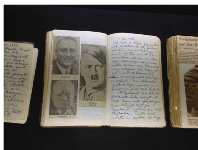
Przykładowe karty z „dziennika wojennego” eksponowane podczas wystawy „The whole world is on fire”.

Opisywanie dramatycznych losów II wojny światowej rozpoczęła 1 września 1939 r. W oparciu o informacje głównie dostarczane przez prasę i radio stworzyła obraz Szwecji i życia codziennego szwedzkiej rodziny w dobie konfliktu międzynarodowego. Każdego roku, kilka razy w miesiącu, przedstawiała wydarzenia wojenne i wielką, światową politykę dołączając do wpisów wycinki prasowe z artykułami, mapami i zdjęciami. Nadto, po roku od wybuchu wojny, cennym źródłem informacji do jej opisu stały się listy wojskowe i prywatne z zagranicy, do których dostęp uzyskała w związku z podjęciem pracy w tajnej cenzurze korespondencji. Stąd w „Dziennikach” znaleźć można cytaty stanowiące „wstrząsające świadectwa cywili, których dosięgła wojna”. A „dosięgła” ona przecież i Polaków. Stąd pojawia się pytanie o Polskę w świetle relacji Lindgren.