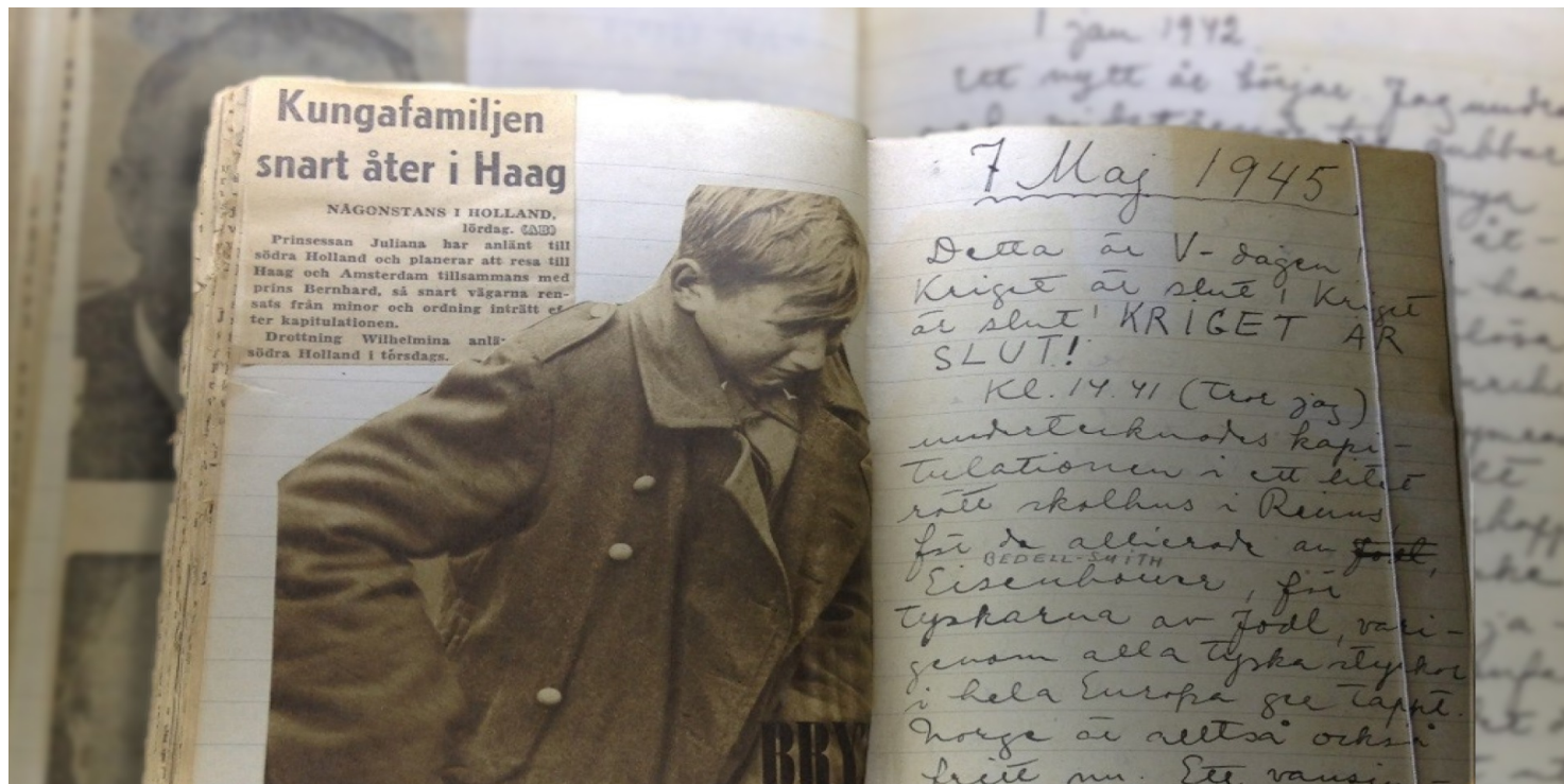
Wklejone do zeszytu wycinki prasowe. Obok odręczny zapis pod data 7 maja 1945 r.

https://przystanekhistoria.pl/pa2/tematy/szwecja/73703,Polska-w-latach-II-wojny-swiatowej-oczami-Astrid-Lindgren.html