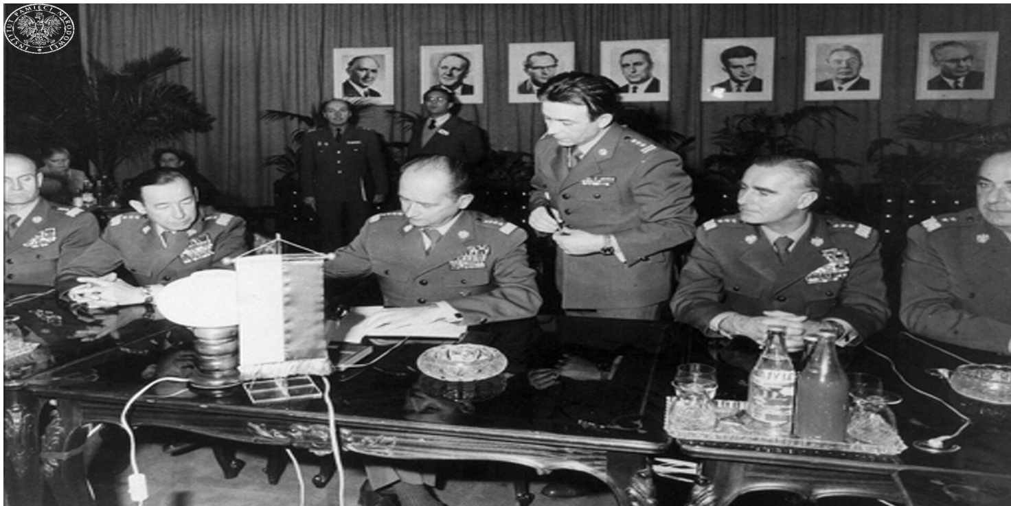
Płk Ryszard Kukliński asystujący gen. Wojciechowi Jaruzelskiemu w siedzibie głównej Układu Warszawskiego, 1979 r.

https://przystanekhistoria.pl/pa2/tematy/tajne-sluzby/101149,Ryszard-Kuklinski-Czlowiek-ktory-umknal-Moskwi.html