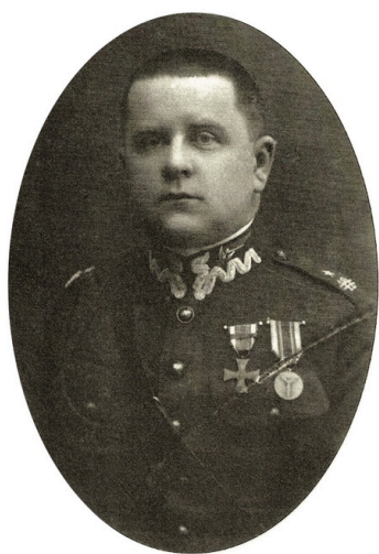
Major Zdzisław Żórawski

22 lutego 1941 r. Żórawski przekroczył granicę portugalsko-hiszpańską na podstawie dwutygodniowej wizy turystycznej. 23 lutego dotarł do Sewilli i zameldował się u króla, przy czym musiał najpierw uzyskać w tym celu pisemną zgodę prefekta miejscowej policji. Karol II mieszkał w jednym z sewilskich hoteli, strzeżony przez ośmiu agentów gestapo oraz sześć dwuosobowych posterunków hiszpańskiej policji. 25 lutego Żórawski przewiózł przez granicę regalia królewskie i część klejnotów, jednocześnie sprawdzając wybrane na ucieczkę miejsce. Wrócił do Sewilli na jeden dzień, po czym 26 lutego ponownie wyjechał, przerzucając do Portugalii królewskie archiwum i resztę klejnotów.