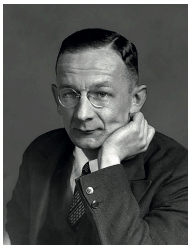
Alfred Birkenmayer

Aresztowany, po zwolnieniu nie zaprzestał pracy, w pewnym momencie przenosząc się tylko do Portugalii. Za tę ofiarność został odznaczony Krzyżem Zasługi z Mieczami. W późniejszym okresie, ze względu na szeroką sieć kontaktów w Argentynie, został kierownikiem placówki wywiadowczej „Salvador” w Buenos Aires, kierując pracami polskiego wywiadu w Argentynie, Urugwaju, Paragwaju, Boliwii i Chile. Zmarł w roku 1990, do końca nie zdradzając rodzinie charakteru swojej pracy w czasie II wojny światowej.