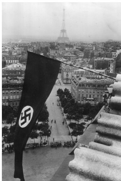
Panorama Paryża z łuku Triumfalnego. Widoczny sztandar ze swastyką zatknięty na szczycie łuku oraz Wieża Eiffla, czerwiec 1940 r.