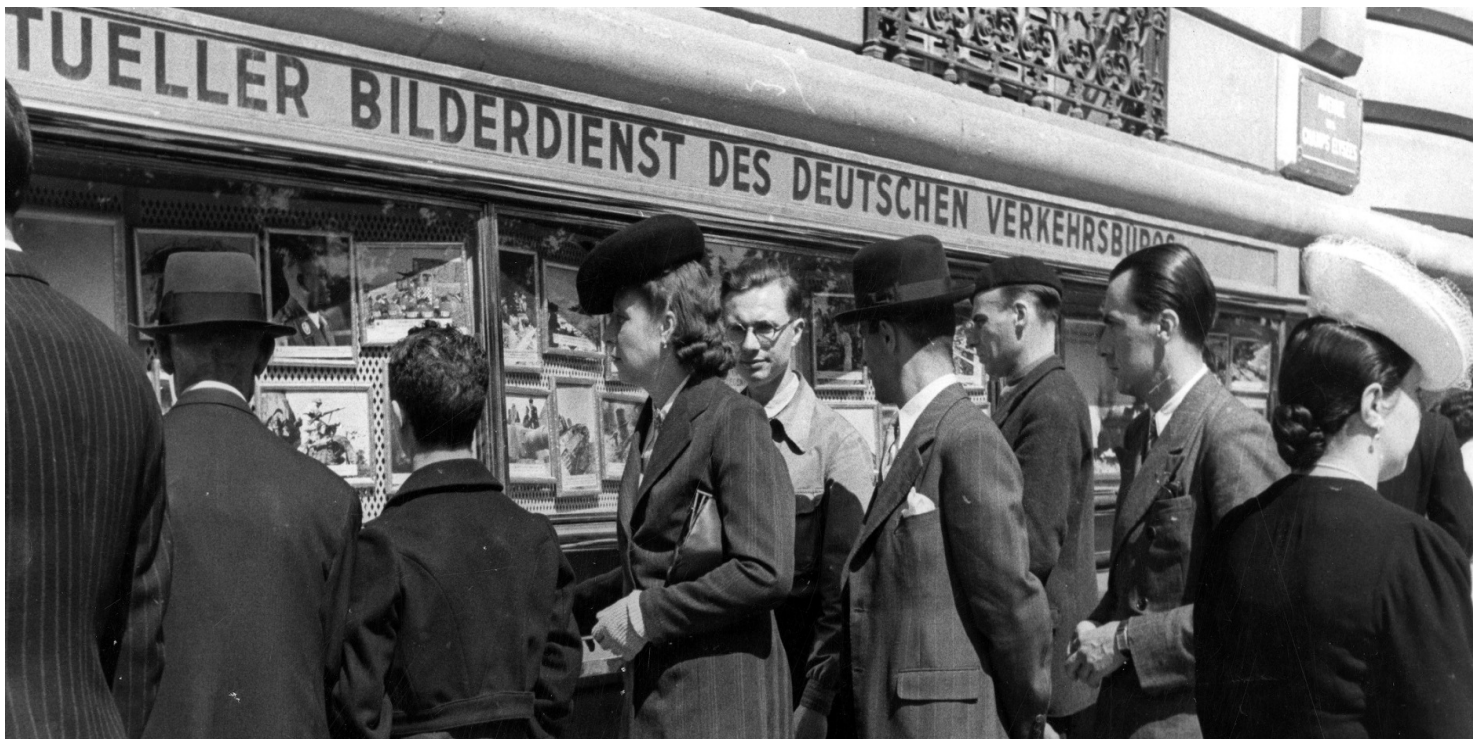
Ludzie przed wystawami zdjęć z terenów wojny, 1943 r.

https://przystanekhistoria.pl/pa2/tematy/tajne-sluzby/103465,Siec-F-2-Polska-organizacja-wywiadowcza-w-okupowanej-Francji.html