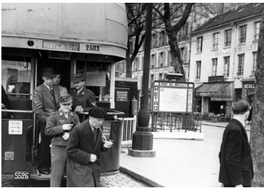
Wejście do metra na Champs Elysees w Paryżu, 1944 r.