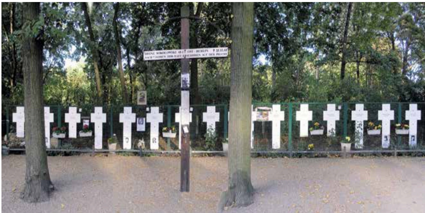
Symboliczne białe krzyże upamiętniające zabitych przy przekraczaniu muru berlińskiego

https://przystanekhistoria.pl/pa2/tematy/tajne-sluzby/103794,Strzal-w-plecy.html