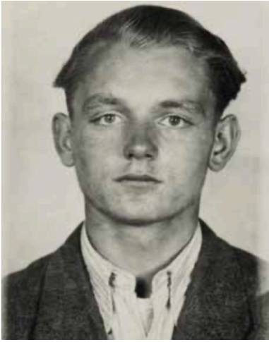
Czesław Kukuczka, zdjęcie sprzed 1955 r.

- stwierdzono z kolei z odręcznym dopiskiem na innym z dokumentów.