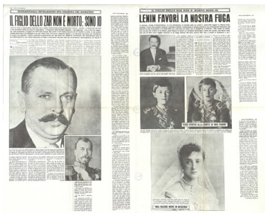
Publikacje prasowe dotyczące Michała Goleniewskiego jako rzekomego syna cara Mikołaja II Romanowa