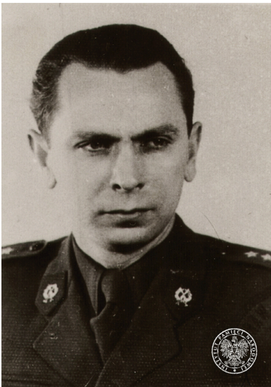
Podpułkownik Michał Goleniewski, ok. 1957 r. Zdjęcie pochodzące z akt osobowych funkcjonariusza