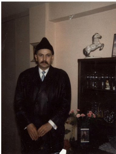
Michał Goleniewski jako „carewicz”