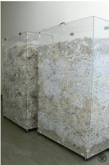
Gabloty ze zniszczonymi aktami służb terroru i represji PRL.

Niszczenie akt nie ominęło także materiałów archiwalnych wojskowych organów bezpieczeństwa komunistycznego państwa.