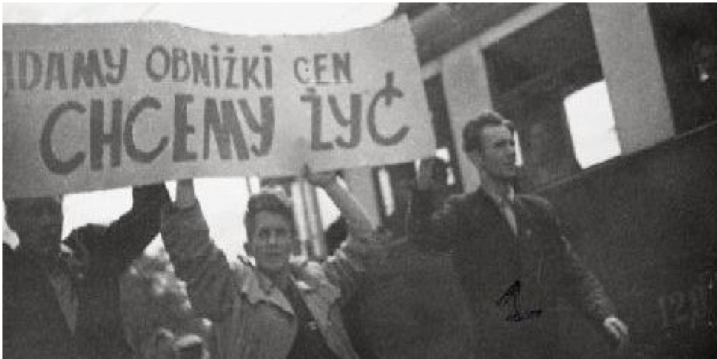
Fot. z zasobu IPN

https://przystanekhistoria.pl/pa2/tematy/tajne-sluzby/67281,Poznanski-Czerwiec-1956-w-dokumentach-CIA.html