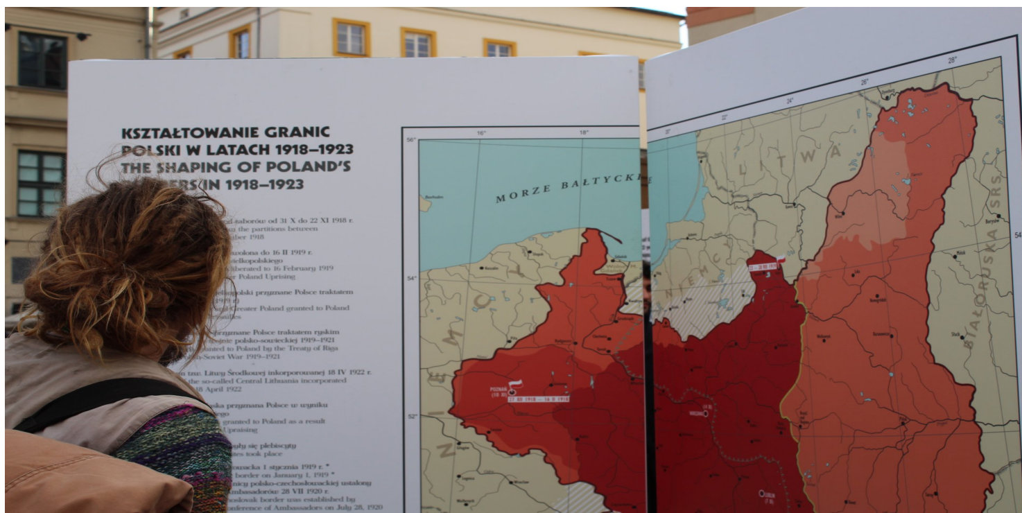
Plansza z wystawy IPN „Ojcowie Niepodległości”

https://przystanekhistoria.pl/pa2/tematy/traktat-ryski/73976,Wojna-polsko-bolszewicka-1920-roku.html