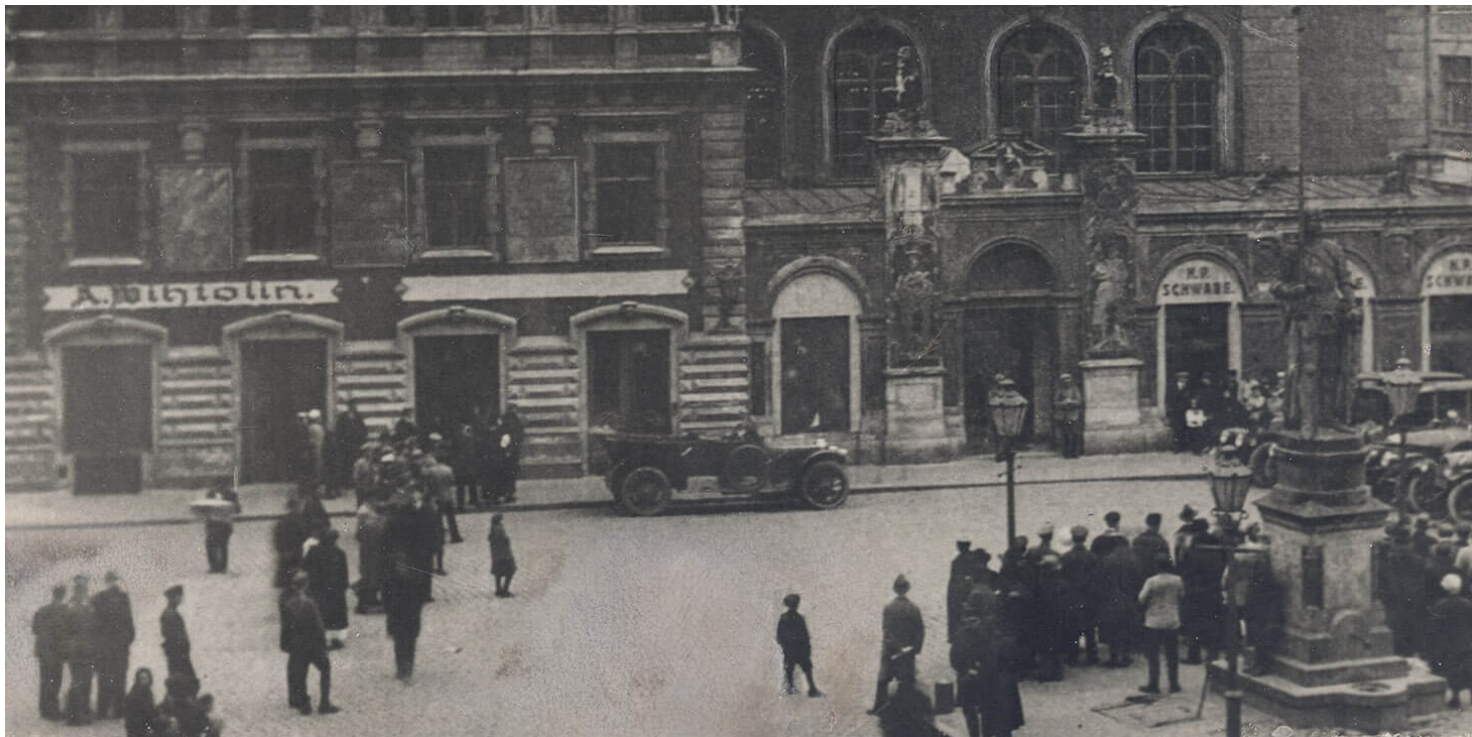
Pałac Czarobogorodków w Rydze, w którym odbyły się rokowania pokojowe polsko-sowieckie.

https://przystanekhistoria.pl/pa2/tematy/traktat-ryski/77855,Niewykonanie-Traktatu-Ryskiego-przez-ZSRS.html