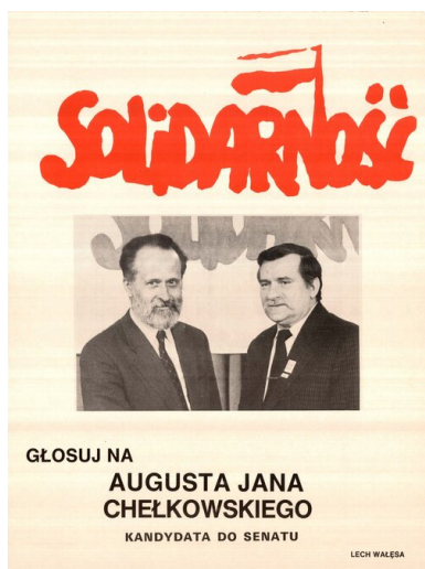
Wybory czerwcowe 1989 r. Plakat

Trudną do przecenienia rolę w kampanii odegrały rozrzucone w postaci ulotek instrukcje wyborcze. Najskuteczniejsze okazały się tzw. ściągki, na których umieszczono szczegółową informację na kogo głosować, a kogo skreślić (na większości z nich zapisano tylko nazwiska kandydatów KO na senatorów oraz na posłów w poszczególnych okręgach, wraz z zaleceniem, by pozostałe osoby wykreślić). Ulotki tego typu zaczęto rozrzucać już pod koniec kwietnia.