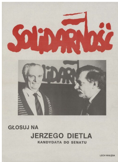
Plakat wyborczy Jerzego Dietla