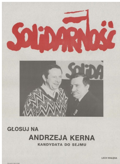
Plakat wyborczy Andrzeja Kerna