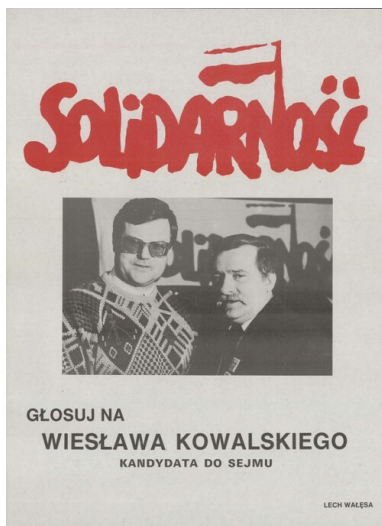
Plakat wyborczy Wiesława Kowalskiego