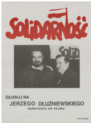
Plakat wyborczy Jerzego Dłużniewskiego