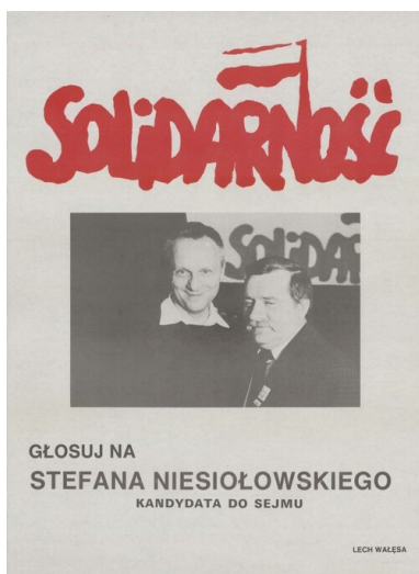
Plakat wyborczy Stefana Niesiołowskiego