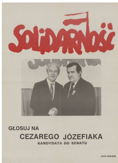
Plakat wyborczy Cezarego Józefiaka