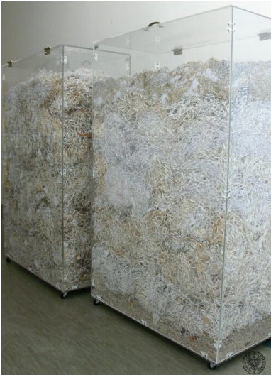
Gabloty ze zniszczonymi aktami służb terroru i represji PRL

uznano za konieczne ich internowanie (w ramach akcji o kryptonimie „Jodła”) z chwilą wprowadzenia stanu wojennego. W odróżnieniu od akt lustrowanego TW „Jędrka”, teczki pozostałych dwóch TW o pseudonimach „Anhelli” i „Sufler” zachowały się. W teczkach obu tych TW zachowały się zarówno pobierane w ramach akcji „Klon” lojalki, jak i pisemne zobowiązania do ich współpracy z SB. Dokumentacja z tych akt, jak i weryfikujące ją przesłuchania obrazowały zupełnie inne losy tych dwóch osób: TW „Sufler” współpracował z SB do roku 1990 i był bardzo cenionym źródłem – co potwierdził jego drugi oficer prowadzący oraz sam TW przesłuchany jako świadek. Natomiast TW „Anhelli” podczas pierwszego spotkania po werbunku, w lutym 1982 roku stanowczo odmówił współpracy i oświadczył funkcjonariuszowi, że zobowiązanie podpisał pod presją i ze strachu, ale obecnie odmawia wszelkich kontaktów i jest gotów ponieść tego konsekwencje. Sprawy te miały jeden wspólny mianownik: dokumentacja TW była prowadzona przez funkcjonariusza bardzo rzetelnie i odzwierciedlała jego rzeczywiste kontakty z tymi osobami, a odmawiający współpracy TW „Anhelli” został niezwłocznie wykreślony z rejestru TW – co wytrącało argumenty o rzekomo fikcyjnej rejestracji „dla poprawienia statystyki” co do lustrowanego TW „Jędrka”.